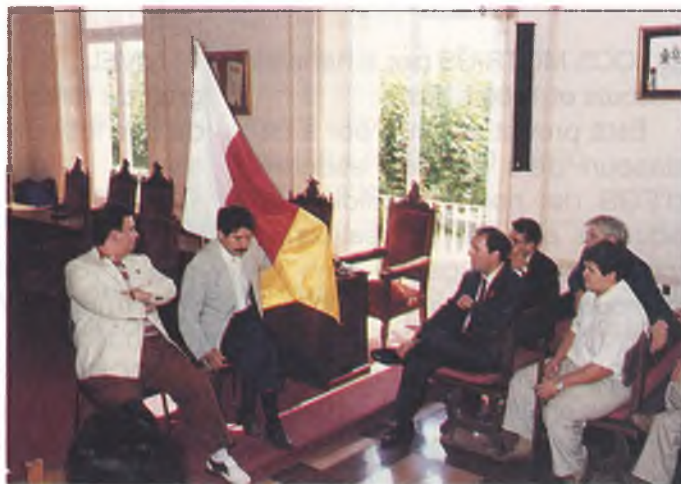
Presentació de la bandera al saló de sessions de l'Ajuntament.

◆ La bandera oficial de la ciutat de Sant Feliu està composta per tres bandes verticals que porten els colors blanc, vermell i groc. Així ho varen explicar els responsables de la societat Catalana de Vexil·lologia a qui l'Ajuntament, a instàncies de la Generalitat de Catalunya, va encarregar un estudi per definir, segons criteris heràldics, com havia de ser la bandera. Després d'estudiar l'escut de Sant Feliu i documents històrics, l'informe dels experts va definir la bandera de Sant Feliu d'aquesta manera. La bandera, segons els experts, ha de mantenir sempre aquestes tres bandes netes, ja que no hi pot figurar cap mena d'escut o inscripció.