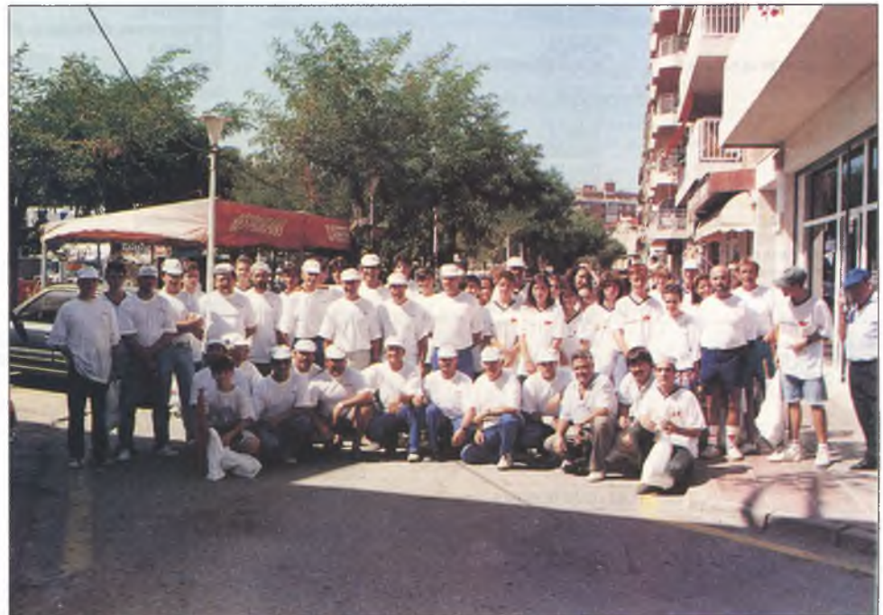
El difícil traçat de la contrarellotge va fer molt interessant la cursa. Aquests són alguns dels voluntaris que varen col·laborar en l'organització.