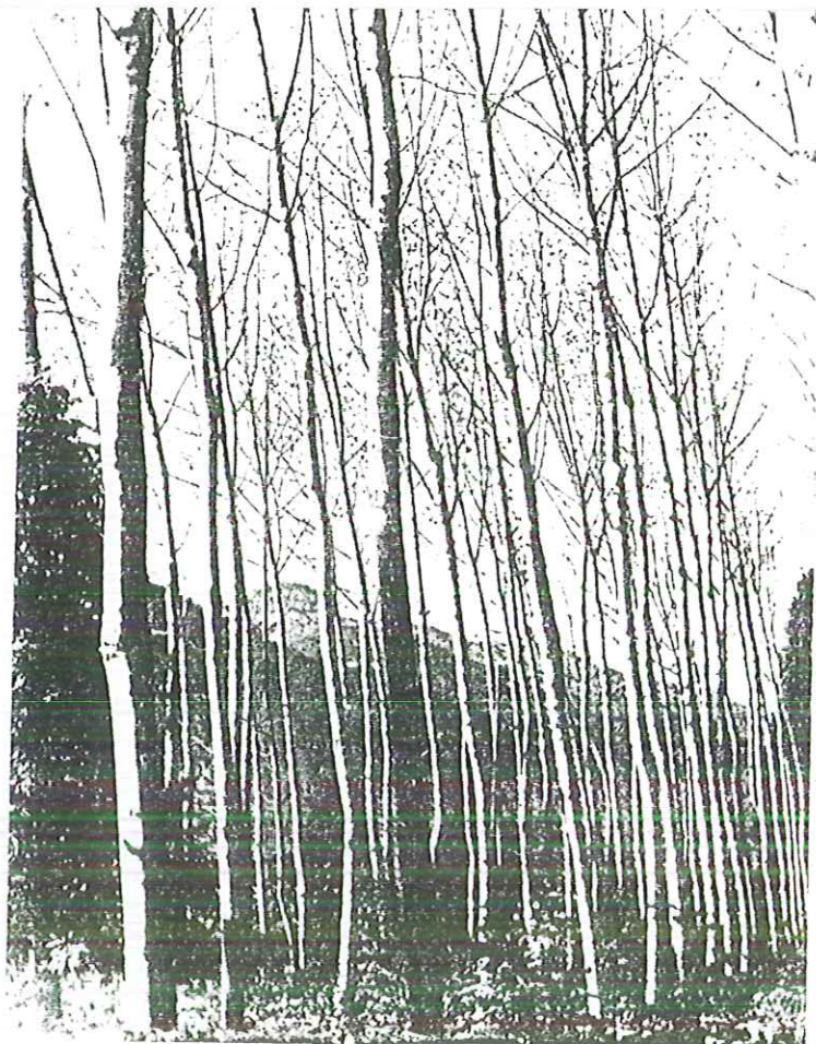
«Blanc - Negro». II Premio Concurso Fotográfico.