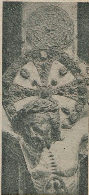
Puede apreciarse el medallón con motivos de caza sobre el nimbo crucífero.

Cuando la liebre figuraba en las esculturas medievales, por el hecho de existir liebres bisexuales, se consideraba a la liebre como símbolo de los hombres viciosos, lo que está en consonancia con la doctrina expuesta por Cirilo de Alejandría, al decirnos que la liebre es un animal inmundo por su sensualidad, y que por eso no la usaban los judíos como alimento. El halcón, como todas las aves de rapiña, es símbolo del demonio; el ladrón de almas, como le llama San Agustín, aquel que está siempre