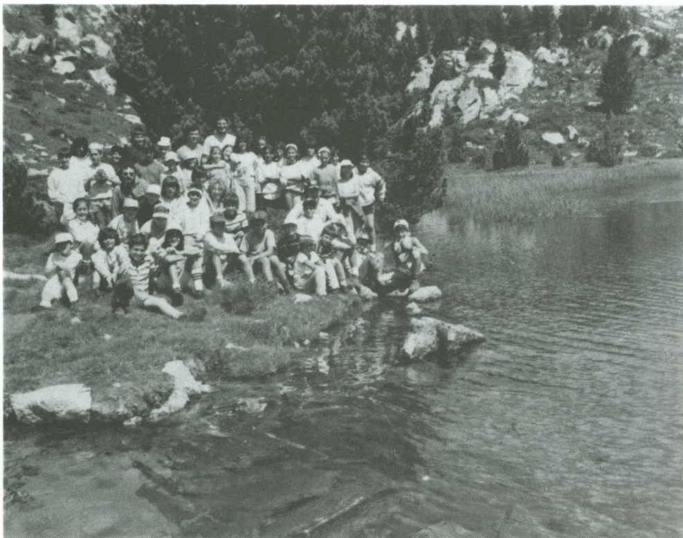
El grup de Colònies, pels paratges de La Cerdanya.