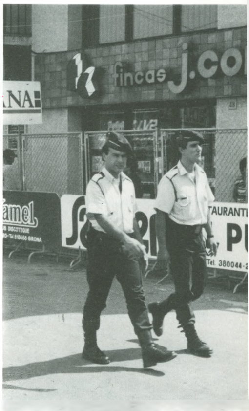
Una novetat que ens aportà la «Volta»: la presència per primera vegada a la nostra vila dels Mossos d'Esquadra.