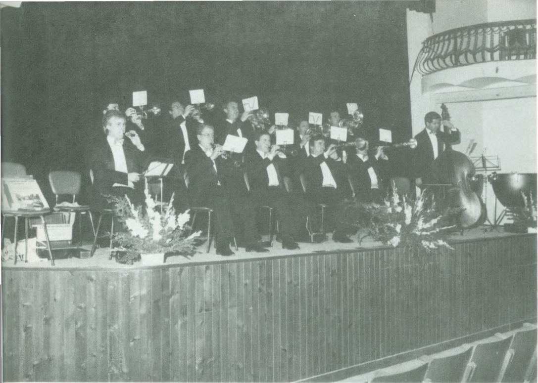
«La Principal de la Bisbal», en un moment del seu concert de música de cobla. La Pubilla, amb les seves Dames.