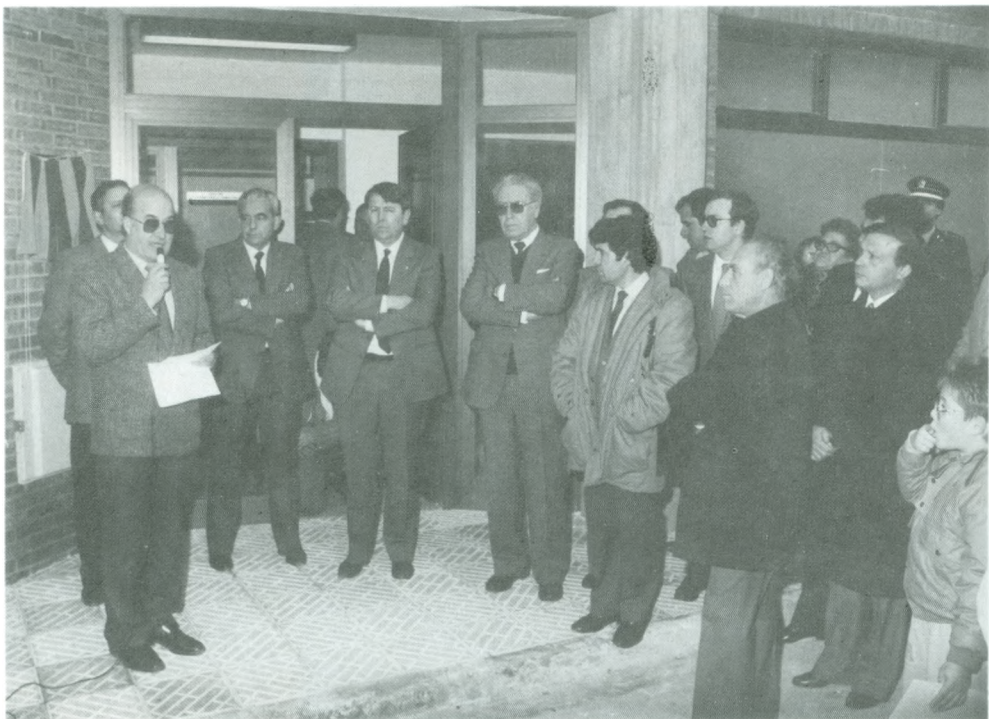
Un moment de l'acte oficial, amb el parlament del batlle.

En resum, una realització necessària, que ve a cobrir tota una colla de serveis socials que afecten la major part de la població.