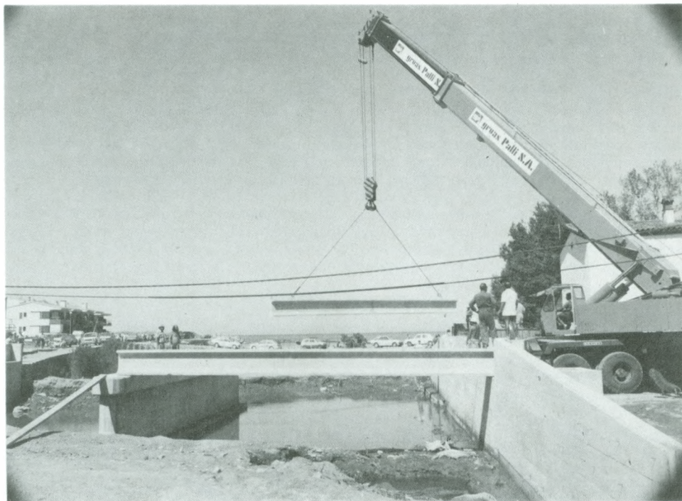
La construcció del pont sobre la riera tingué el seu punt culminant en la col·locació de les bigues.

La Bateria, amb acord del Sr. Salvat, ha vist fet darrerament el seu enllumenat. De mica en mica, es va posant la població al nivell que li pertoca quant a serveis i equipaments col·lectius.