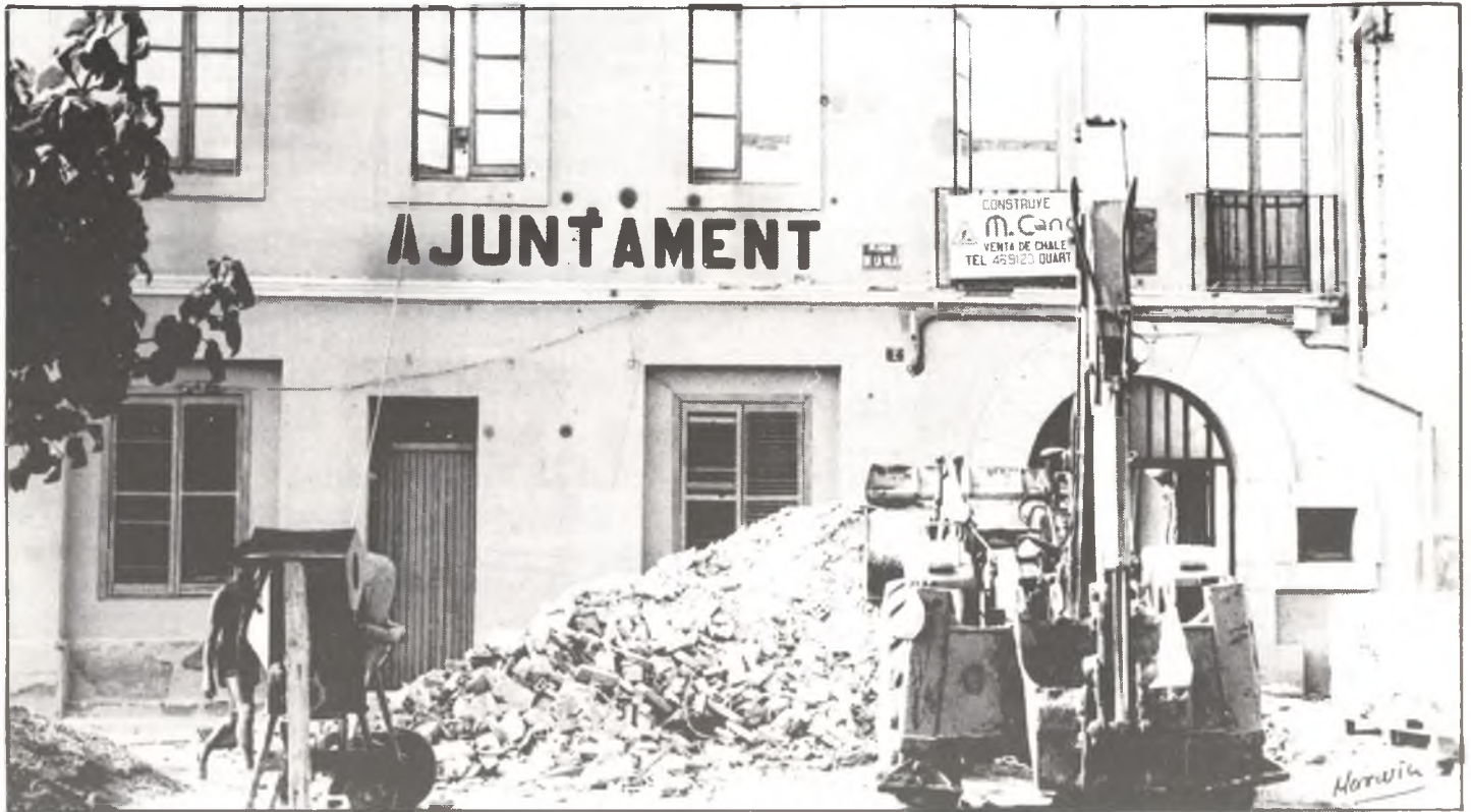
Avui en obres, demà un nou Ajuntament.

Després d'haver-se realitzat la 1.ª fase de les obres de Reforma i Ampliació de l'Edifici Municipal, durant aquest estiu es portarà a terme la 2.ª fase, que finalitzarà el mes de setembre, amb el que disposarem de millors instal·lacions per a l'Escola i l'Ajuntament. La inversió total superarà els 10.000.000 de pessetes.