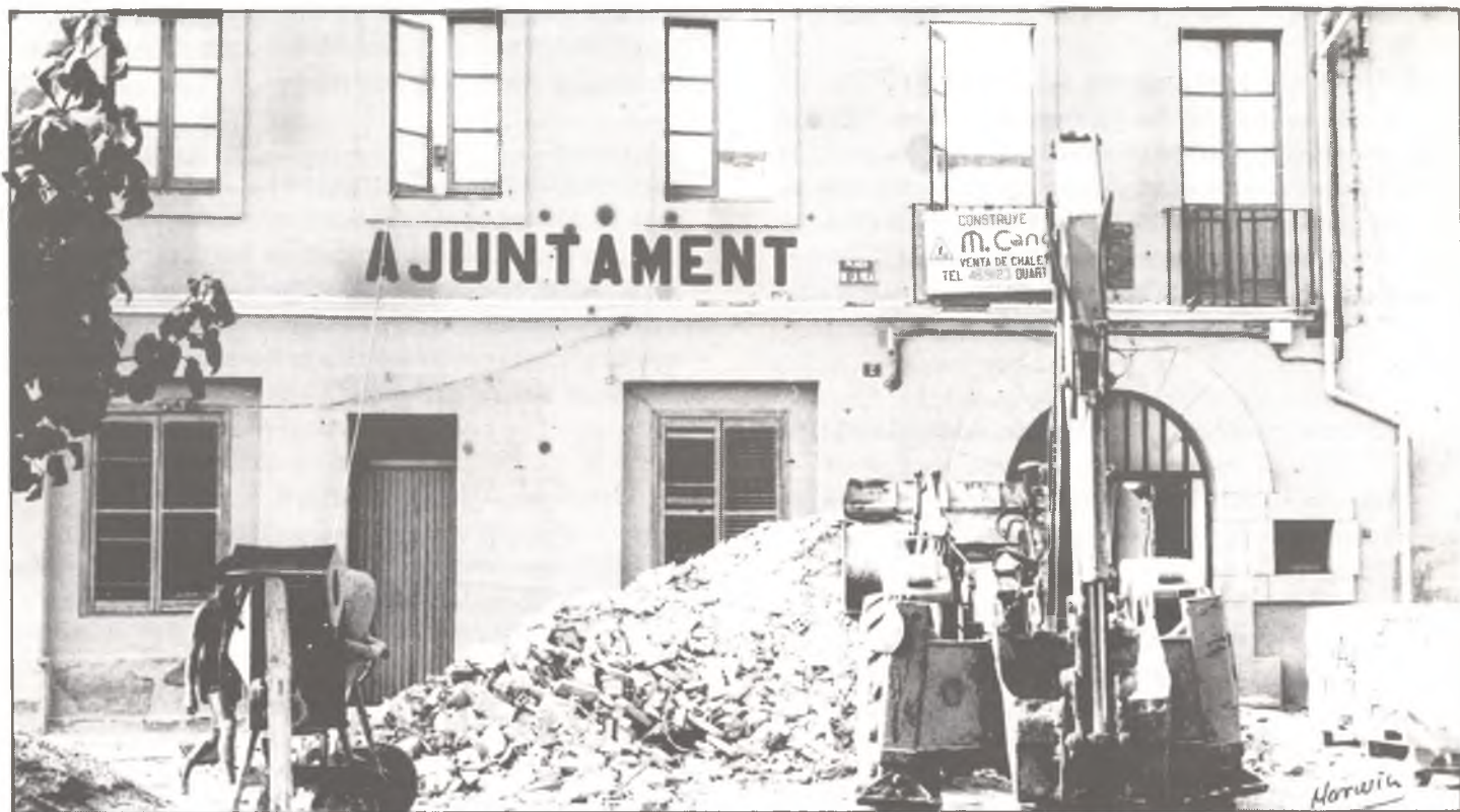
Hoy en obras, mañana un nuevo Ayuntamiento.

Después de haberse realizado la 1.ª fase de las obras de Reforma y Ampliación del Edificio Municipal, durante este verano se llevará a cabo la 2.ª fase, que se finalizará en septiembre, con lo cual dispondremos de mejores instalaciones para la Escuela y el Ayuntamiento. La inversión global superará los 10.000.000 de pesetas.