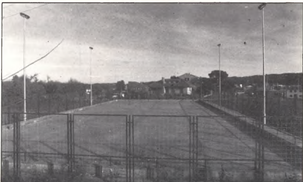
Pista Poliesportiva de Quart. Pista Polideportiva de Quart.