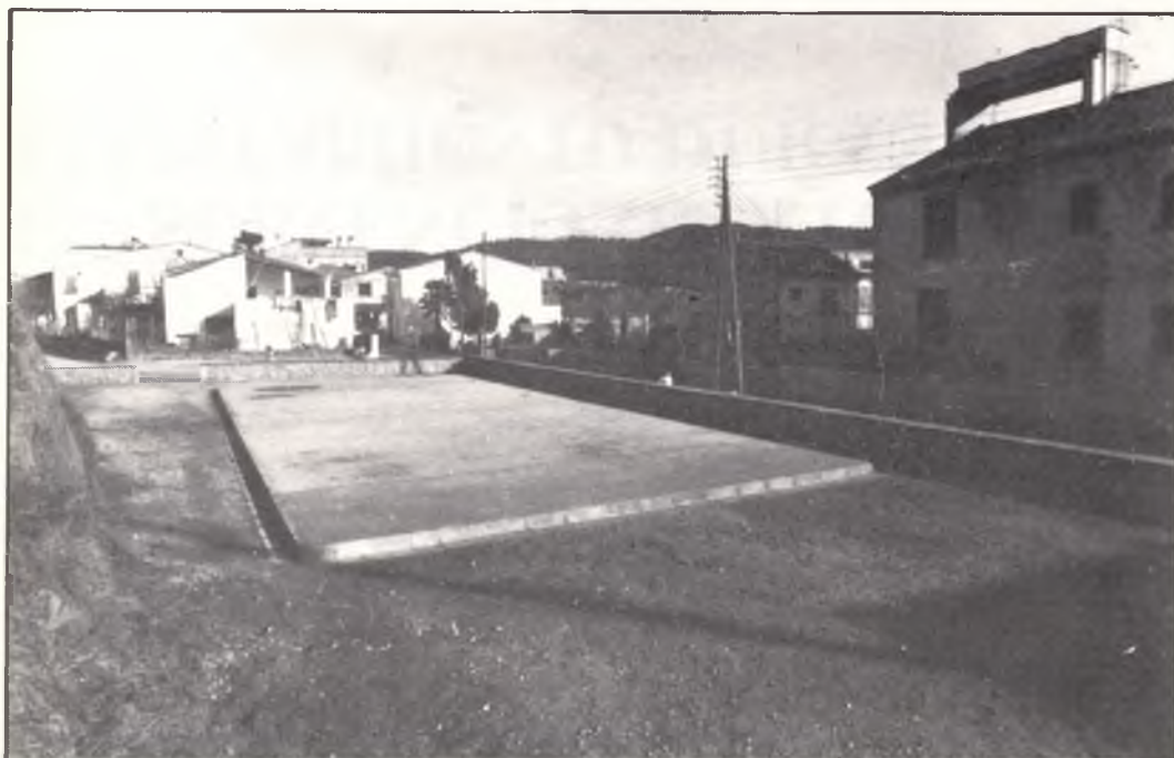
Pista Poliesportiva de La Creueta. Pista Polideportiva de La Creueta.