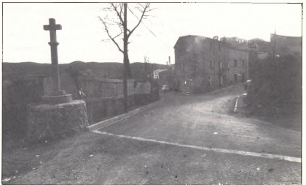
Carrers urbanitzats de La Creueta. Calles urbanizadas de La Creueta.