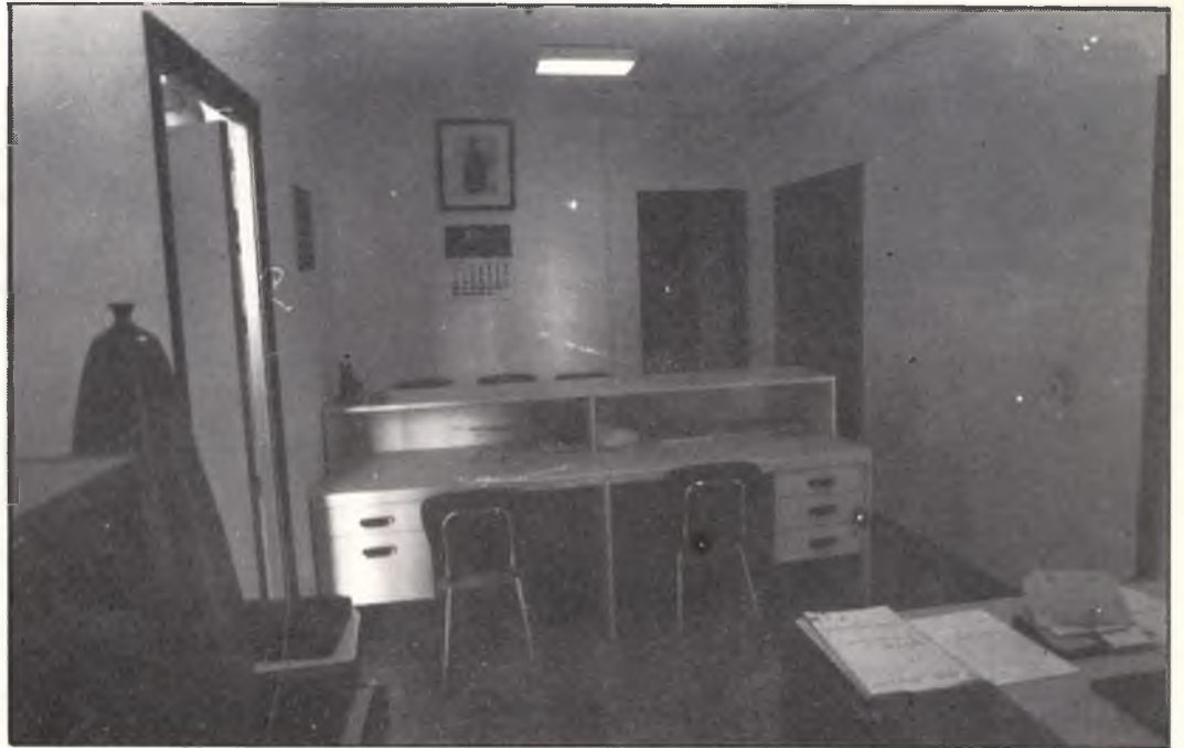
Oficines municipals. Oficinas municipales.