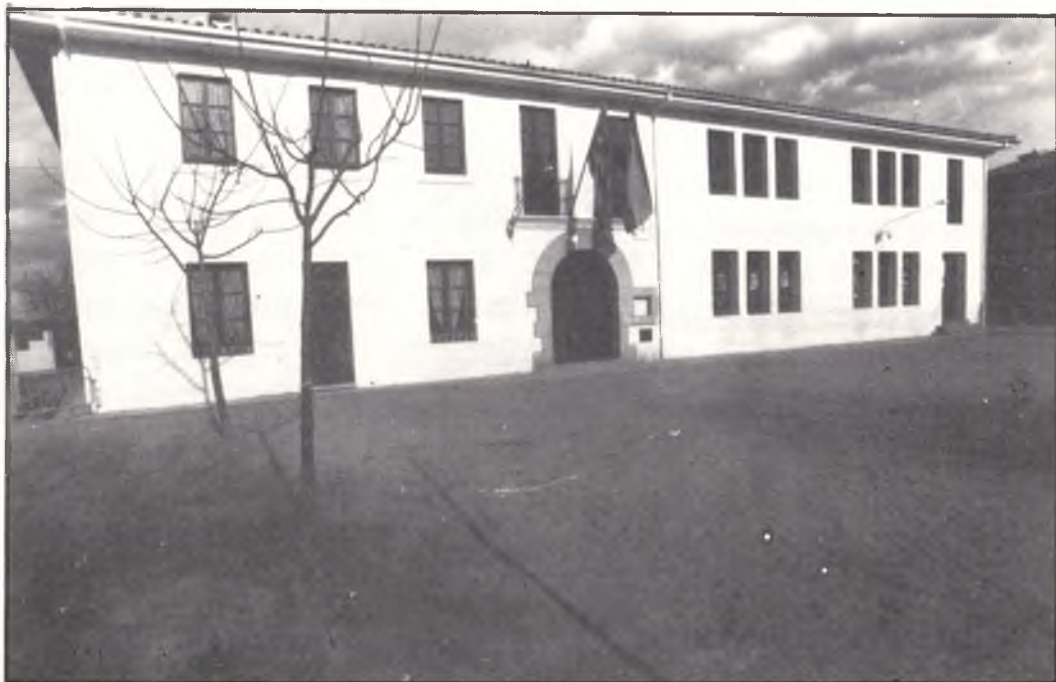
Edifici Municipal. Edificio Municipal.