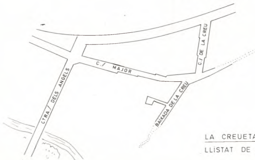
LA CREUETA LLISTAT DE CARRERS