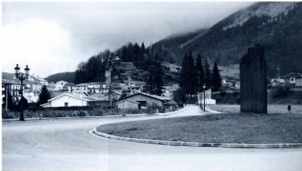
El turó on s'aixecava el castell, vist des de la plaça de la Forcarà

Passaren vint anys. El 1689 l'exèrcit francès va tornar a atacar: el duc de Noailles assetjà el castell.