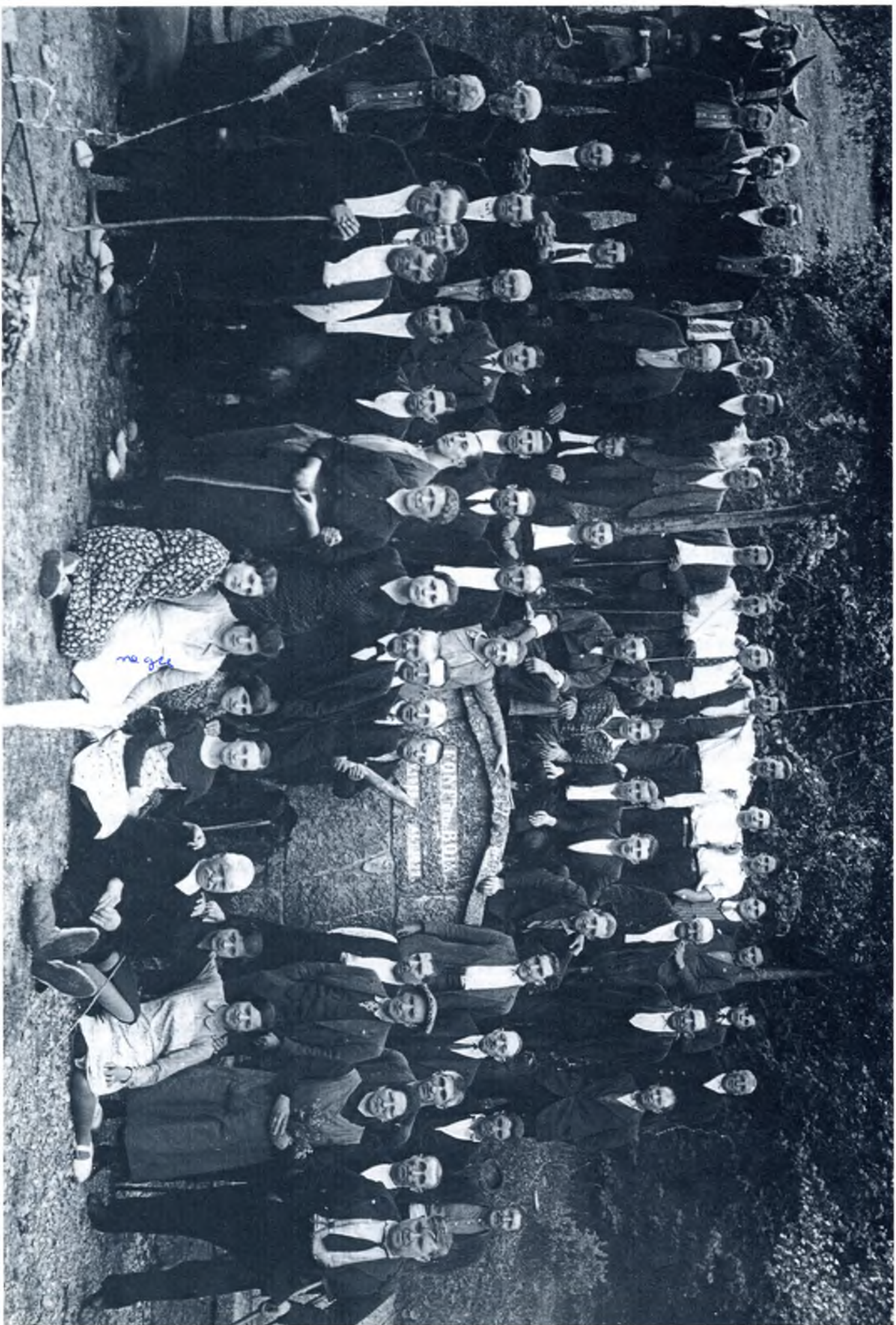
Dinar de socis a la font del Boix. Època de la República