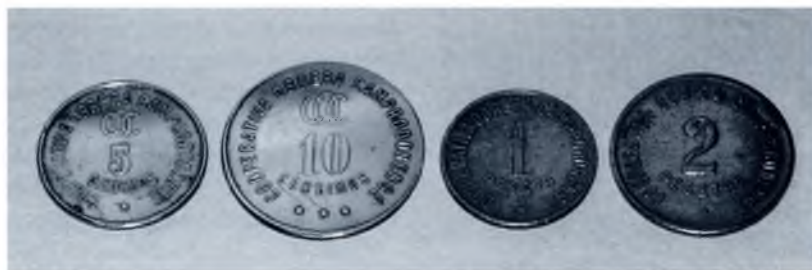
Monedes per a ús dels associats (5 i 10 cts.; 1 i 2 ptes.)