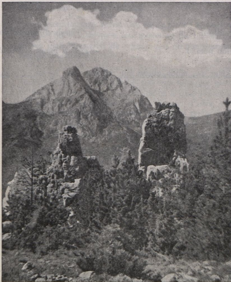
El Pedraforca des de Serra Encija