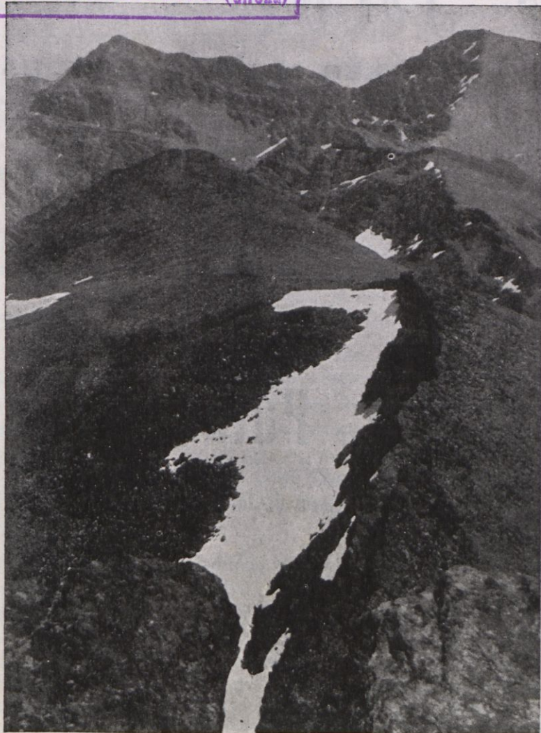
Els pics del Mulhacen (a la dreta) i l'Alcazaba (a l'esquerra) des del Veleta. Un dels més alts d'Espanya