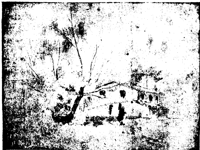
IU PASCUAL (Dibuix)

En honorar avui les nostres pàgines amb un dibuix del pintor Iu Pascual, creiem serà oportú insistir sobre alguns punts d'obrir que varem senyalar en el catàleg de la primera Exposició de Dibuixos celebrada a la Sala Vayreda farà poc més d'un any i mig. Fèiem remarcar allí, no sols l'interès extraordinari que, per a les Arts plàstiques, té el coneixement del dibuix sinó també la superioritat manifesta que sobre la realització d'una obra pictòrica, poden tenir els apunts i estudis que precediren a la seva execució, fins a l'extrem que, a voltes, aquesta no sols no aconsegueix superar-los d'una manera definitiva, sinó que com en el cas, que allí esmentàvem, dels dibuixos de Miquel Angel per a la Capella Sixtina, sembla com si aquests dibuixos quedessen més vius que les mateixes pintures.