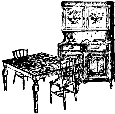
Bufet modern Taula de 100 X 90 cms. Sis cadires