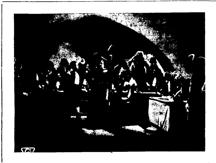
Del film «Les grades d'un tron»

El cinema terrorífic ha arribat també a les nostres sales; darrerament hem vist «El Doctor Frankenstein», que ens féu recordar el menys afortunat encara, «Dràcula», parlada en espanyol, que tenia, no cal dir, innombrables defectes. De «gangsters» també se n'han projectat últimament, sense que veiéssim, però, res extraordinàriament remarcable— si exceptuem «L'acusador desí mateix» on William Powell exhibeix tot el seu art en l'expressió del sentiment, mit-