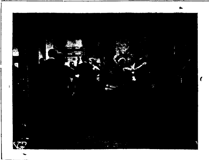
Del film «Gran Gala Travesti»

interessantíssim: «Quatre d'Infanteria», film de guerra de Pabst, i l'«Exprès Blau», film rus de Trauberg, una mostra del què és el cinema soviètic, que ja