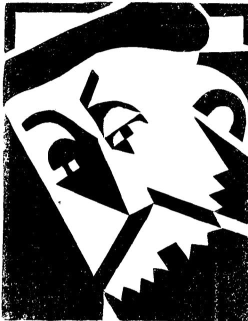
(Linòleum de J. M. Dou)

Sobressurt del formidable davassall líric que són aquests poemes, la línia temàtica simple. Impregnats d'una rara emanació terral, sentiu el bategar de la vida sota la regna tensa que priva el vers de desencaminar-se. Solament arriben a assolir una llibertat completa les imatges que integren