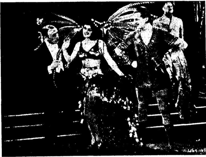
Del film «Madam Satan»

Aquest és el cas d'«Un home de sort», pel·lícula de la Paramount, per Roberto Rey, i diàleg de Muñoz Seca. Les seves «astracanades» no fan de bon tros l'efecte calculat, perquè no és el mateix un sainet o una pel·lícula, ni que sigui parlada. Ens presenta un jardiner català poca-solta, segurament inspirant-se en una catalanofòbia mal dissimulada, i li fa parlar un