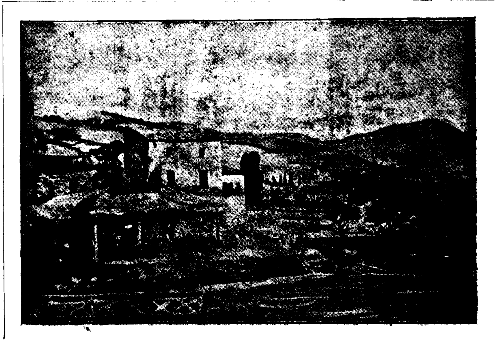
PINTURA DE DOMÈNEC CARLES