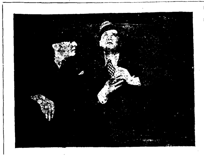
Del film «El Gran Charco»

Avui i demà al Teatre Principal | haurà d'interessar als aficionats al es projectarà «Noche de Duendes», | haurà d'interessar als aficionats al