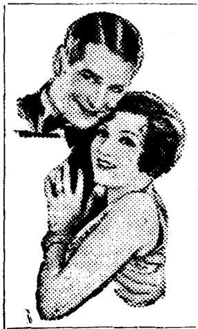
Del film «El Gran Charco»

Tres hem dit que eren les produccions que han donat nom a René Clair: «Sota les teulades de París», «El Milió» i «Visca la Llibertat», de manera que coneguda també, pel nostre públic, el primer d'aquests film, sols li resta admirar el tercer, conceixença que és de creure no es farà