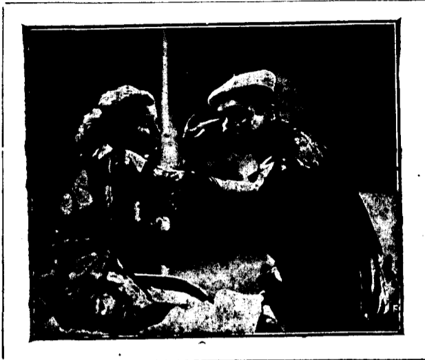
Del film «Pez de Tierra»