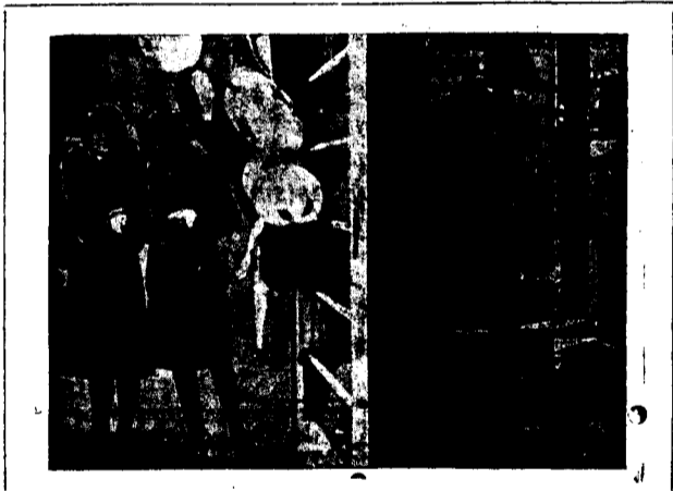
Del film «M», de Fritz Lang

Avui i demà es projecten en aquest mateix cinema «Cel robot», per Nancy Carroll, i una altra producció «Paramount» «La Incorregible», film parlat en espanyol.