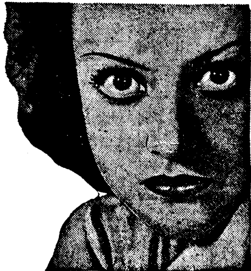
Del film «Pagada»

força distreta i gairebé direm interessant pels que miren i escolten al cinema per passar l'estona. Sempre és un atractiu veure passar per la pantalla i escoltar la veu d'estels que compten amb tants admiradors com Charles Farrell, Janet Gaynor, Will Rogers, Marjorie White, etc.