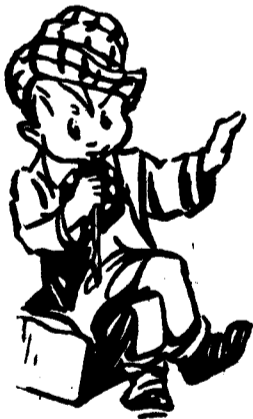
De «Les Aventures de Skippy»