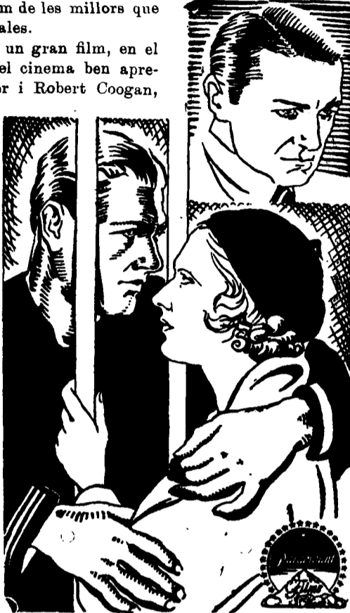
De la pel·lícula «El Secret de l'Advocat»

Per avui i demà, es projectaran les pel·lícules «Joves Pecadors» de la Fox, amb Dorothy Jordan, Thomas Meighan i Hardie Albrighur, «Un Caballero de Frac» parlada i cantada en espanyol de la «Paramount», pels artistes Roberto Rey, Glòria Guzman, Miguel Pitouto, Rosita Diaz i els cèlebres clowns Antonet i Baby.