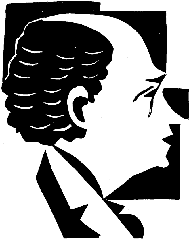
(Linòleum de J. M. a Dou)

Acaba dient que confia en aquesta voluntat per aconseguir la llibertat integral de la nostra terra. Una gran ovació i sincera va acollir les seves paraules finals, així com en diversos passatges del seu interessant discurs.