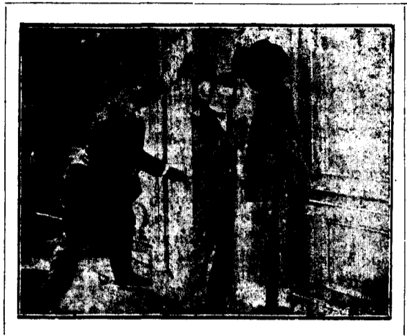
De la pel·lícula «Politiquerías»