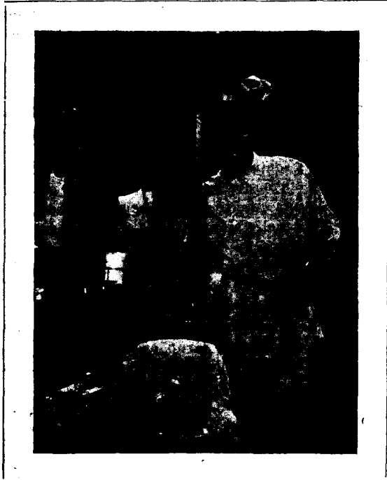
Del film «L'Expres de l'Amor»

Ens permetiem considerar la setmana darrera com a final de temporada, però en realitat no cal pensar en classificar les representacions de cinema que es donguin a la nostra ciutat, com si fóssim a la capital. Per començar, doncs, aquesta—diem-ne—temporada nostra, varen presentar-se bones pel·lícules, tant al Cinema Ideal Park, com al del Teatre Principal.