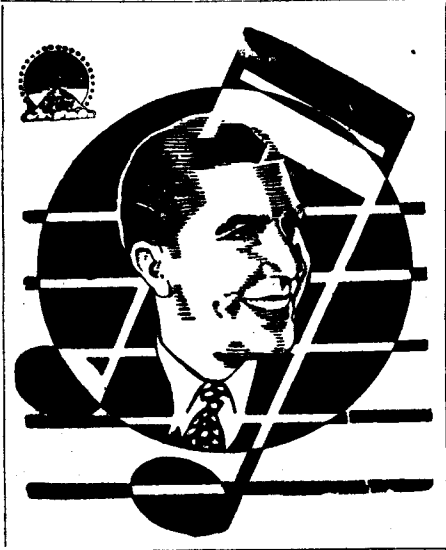
Carlitos Gardel del film «Les llums de Buenos Aires»

Amb l'espai tan reduït de què disposem ens és difícil parlar com voldríem de les projeccions d'aquesta setmana, procurarem però aprofitar-lo amb lleugeres impressions.