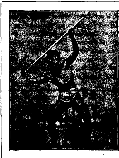
Del film «Tabú»

La significació de Tabú podríem definir-la amb el mot prohibició, i en general s'aplica a tot allò que no deu ésser tocat: és natural, doncs, que l'abast d'aquest nom