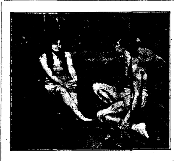
Del film «Tabú»

Tota vegada que el proper dimarts ens serà permès—per fi!—veure desfilant pels nostres ulls la meravellosa pel·lícula de Murnau, serà bo de parlar, encara que molt superficialment pel poc espai que disposem, d'aquest mot, la significació del qual ha servit d'argument al film esmentat.