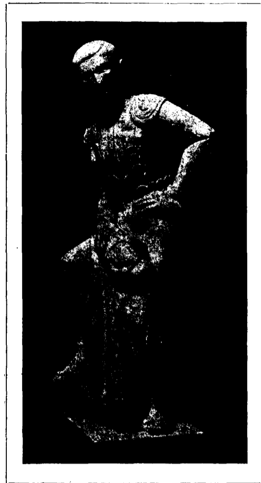
Escultura de Josep Granyer

Creiem que deu ésser considerat com un fet digne de la més alta estima el que el Grup d'Artistes Independents de Barcelona, s'hagi dignat venir a exposar les seves obres a la Sala Vayreda; a més, tenint en compte que no es tracta d'una exposició les obres de la qual siguin destinades a la venda, sinó d'una manifestació d'estímul per a la inscripció a l'organisme que constituït pels cinc artistes expositors i conegut amb el nom del GAI, comença a fer rotllo entre els col·leccionistes de casa nostra.