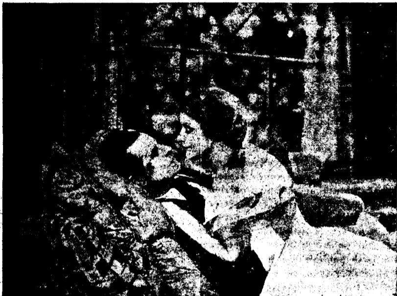
Del film «Música de Besos»

«Papà, piernas largas» pel·lícula per la Janet Gaynor i Warner Baxter, que fou projectada al Teatre Principal, estem segurs que va plaure al públic i val a dir que es desenrotlla amb força dinamisme i té un final no del tot previst, que es pot classificar dintre d'aquest gènere optimista i sense gaires preocupacions que són tan corrents en el cinema que se'ns ofereix cada dia.