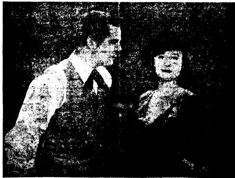
Del film «Música de Besos»