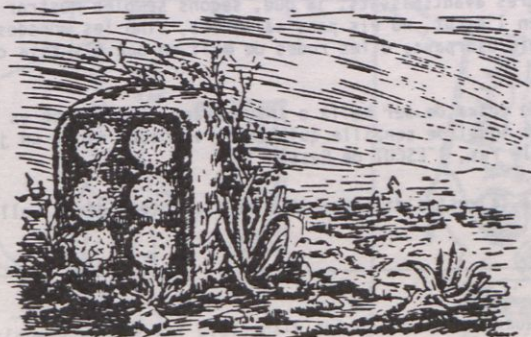
ESCUT DELS MONTCADA

"Ja en 1.359 figuren els Srs. de Montcada com a amos del castell de Cassà i dels 90 focs que tenia la vila. Els Montcada sempre foren mal vistos per la gent de la vila a causa de exigències de senyoriu i per la seva actitud sovint hostil i amenaçadora, foren enemistats amb els senyors de la rodalia, àdhuc amb molts de Girona.