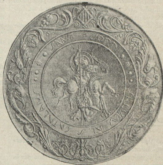
SANT JORDI Ferro repujat de N'Eduard Alegrí

L'exposició de l'Alegrí no és una temptativa; l'artista es presenta resolt i movent-se amb fermesa dintre del seu art. Clar que no és possible ésser exigent en qui comença una ruta. Però contemplant l'obra de l'Alegrí, jo em recordava d'aquell admirable article publicat en aquesta «Fulla» d'En S. Escapa i titulat «L'Escola que ens manca». La formació d'un artista vol una certa disciplina espiritual, vol moltes vegades l'acció de qui sàpiga orientar-lo en els seus primers