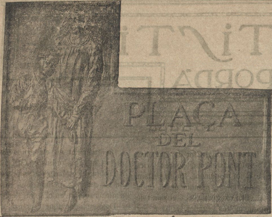
Placa al Dr. Pont — Escultor Cardona. Cadaqués

«L'anticuari», «Els domadors de serps», «La fàbrica de tapisos visitada per uns arabs», «El carnaval a Granada», «La processó disolta per la pluja», «L'escorxador de Portici», «La papellona», «Fantasia mora», «El cafè de les orenetes», «El borratxo», «Idili», i «El jardí dels adarvs» les figures del qual són els retrats dels seus fills idealitzats.