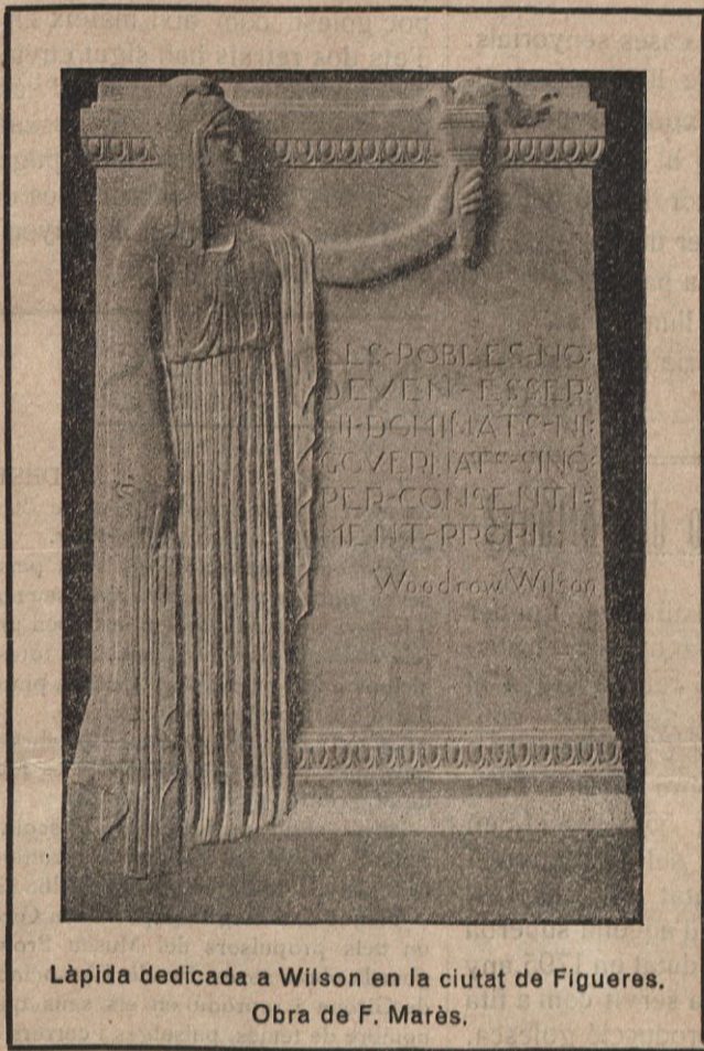
Làpida dedicada a Wilson en la ciutat de Figueres. Obra de F. Marès.

A mes de les obres citades cal recordar: