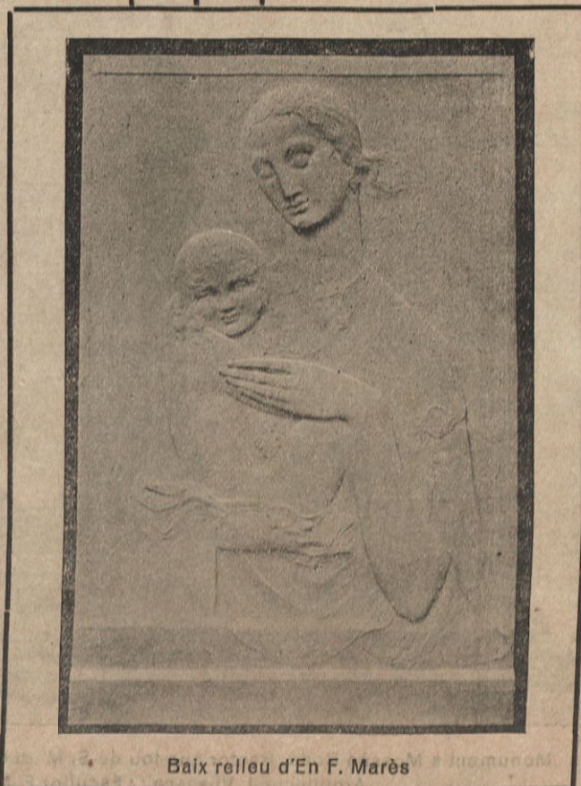
Baix relleu d'En F. Marès