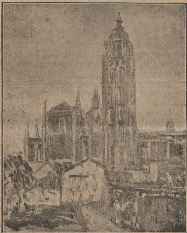
Segòvia.—La Catedral vista des de la Plaça Alfons XIII. D'En Rafel Forn

les dificultats extremes del procediment i converteix els seus apunts, els quadres, en poemes de llum viva, recerques d'harmonies, arribant a aquell art especial del qual digué Manclair, que tot essent plenament pictòric s'acosta tant a la música com s'allunya de la literatura o de la psicologia. Per això, com la majoria dels impresionistes, En Forn conrea amb preferència el paisatge per convenir millor a la seva tècnica.