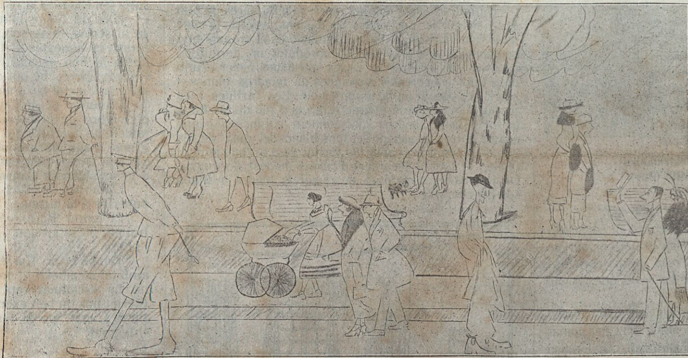
«La Rambla».—Caricatura de Na Rosa Soler Bofill (Pep).

Aquesta serena i equilibrada visió de cada personatge, portant-la de l'un a l'altre sense que la psicologia individual ne surti perjudicada, és la més admirable cosa de Na Rosa Soler. Semblen les seves caricatures com si fossin totes germanes; són com la bellesa de les escultures gregues, que vistes de lluny ens apareixen d'una mateixa família.