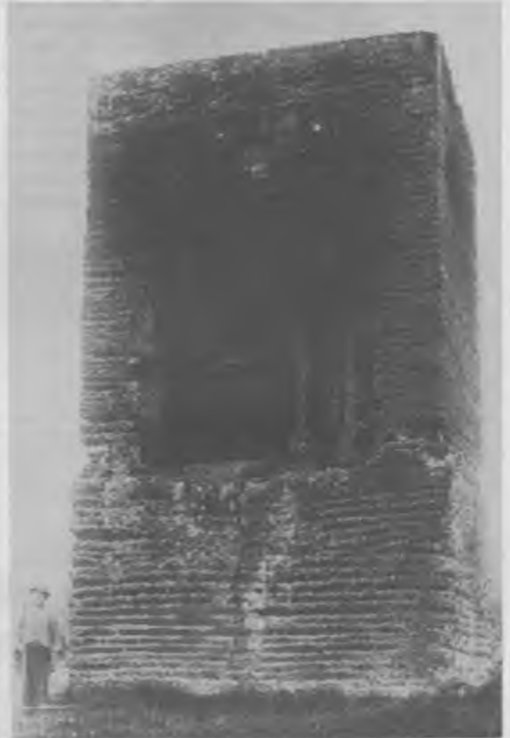
El sepulcre romà de Vilablareix abans de la restauració.

La torre de Vilablareix degué ésser el centre de la necròpolis privada d'una vila que existí a Vilablareix. Les Viles eren gran cases de pagès que tenen llur millor moment en els últims segles de l'Imperi. En elles vivia el propietari latifundista amb la seva família, que així fugia de les obligacions ciutadanes, en un moment que l'Imperi entrava en decadència i s'accentuaven les diferències socials i econòmiques. De les rodalies de Girona coneixem les