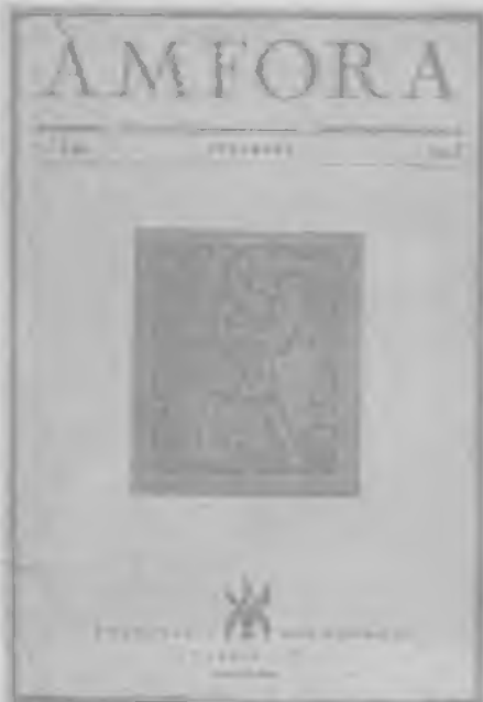
(facsimil de la 1a. plana d'Amfora)

sura governativa, invocant sentiments patriòtics clausurés el PATRONAT per a una bona temporada.