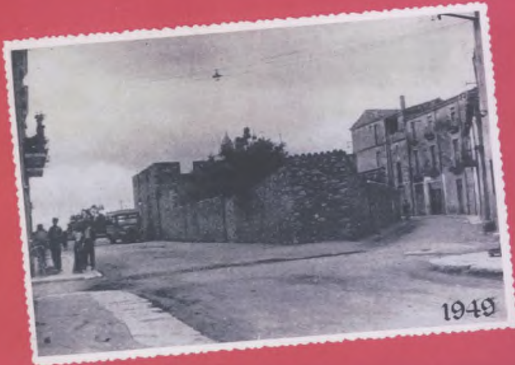
LA PLAÇA DE M n . CINTO VERDAGUER (PLAÇA DELS PEIXOS)