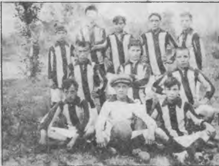
Un dels equips de futbol que ha tingut el Salt.