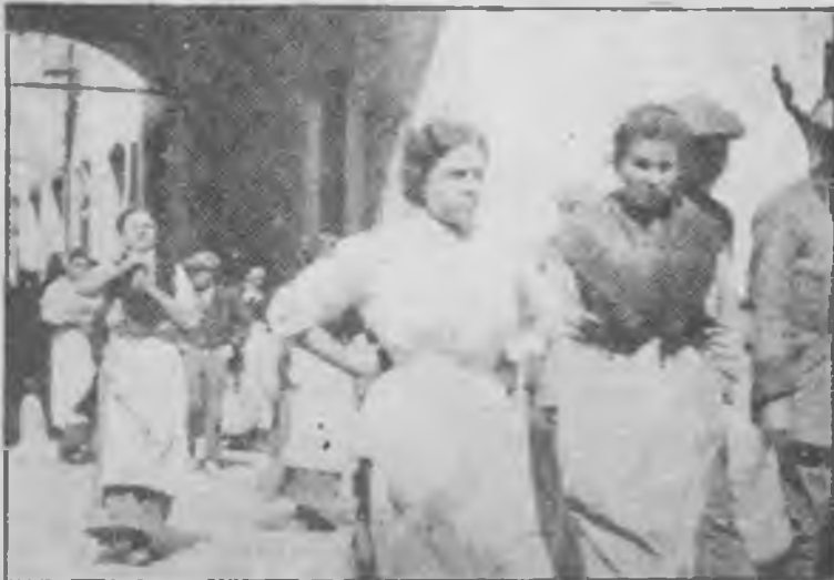
Sortida de les obreres de la fabrica Coma i Cros, als voltants de 1910.