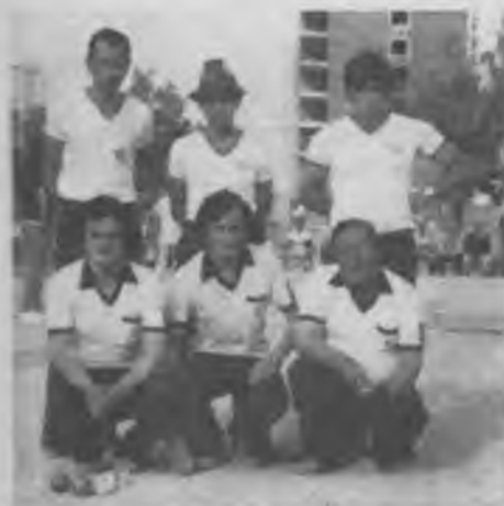
La victòria per 13 0 sobre el Betis ens va col·locar al 17.è lloc.