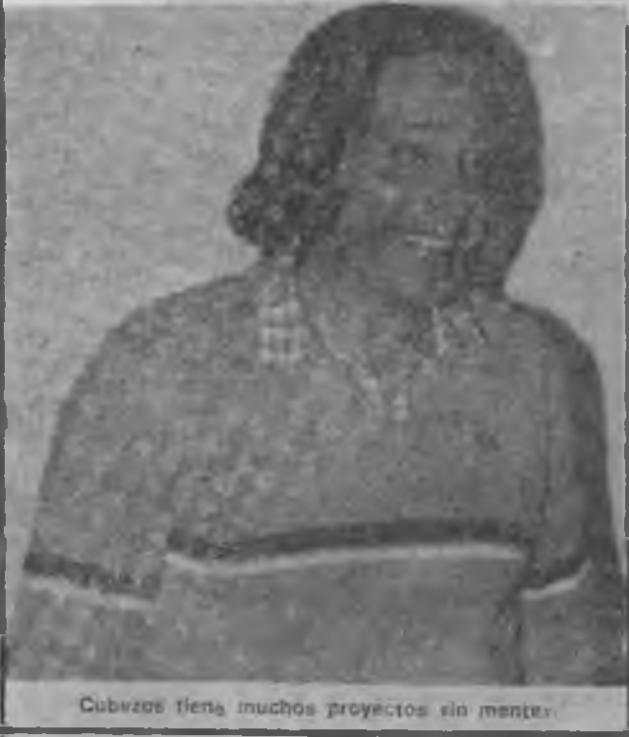
Cubizos tiene muchos proyectos sin mentar.

Manifiesta el nuevo presidente de la Federación Provincial de Bolos