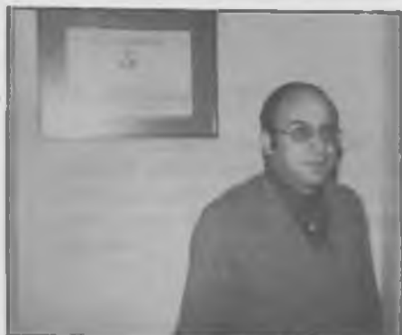
Tripletes classificades a primer i segon lloc del Concurs de Jubilats