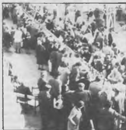
El dia de St. Esteve, Festa del Casal

Al proper número de LA FARGA parlarem de la fita que la nova junta del Casal s'ha proposat, assolir la xifra dels mil socis. Esperem que tots els simpatitzants d'aquest Casal que encara no siguin socis, ens acompanyin a nosaltres per fer del Casal la gran família que ha d'ésser, i que així tots plegats poder-la lograr, una xifra que es pot conquerir fàcilment ja que actualment som ja 800 socis. Endavant, doncs. Animeu vos i col·laboreu amb aquest Casal de Jubilats o amb les seves seccions de Petanca i la Muntanya, ens trobareu a la vostra disposició i sempre sereu ben rebuts.