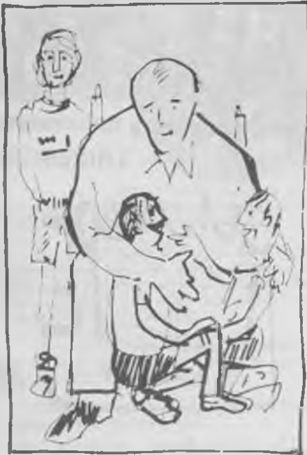
VENTURA PAU i SOLER