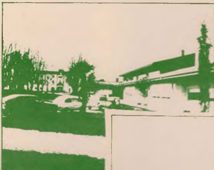
L'Hospital Psiquiàtric necessita això és tasca de tot un equip a partir de la gent que actualment