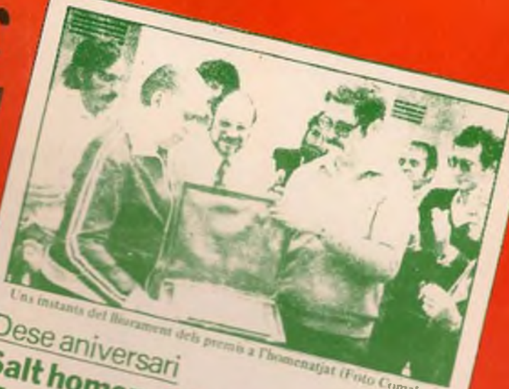
Uns instants del lliurament dels premis a l'homenatjat