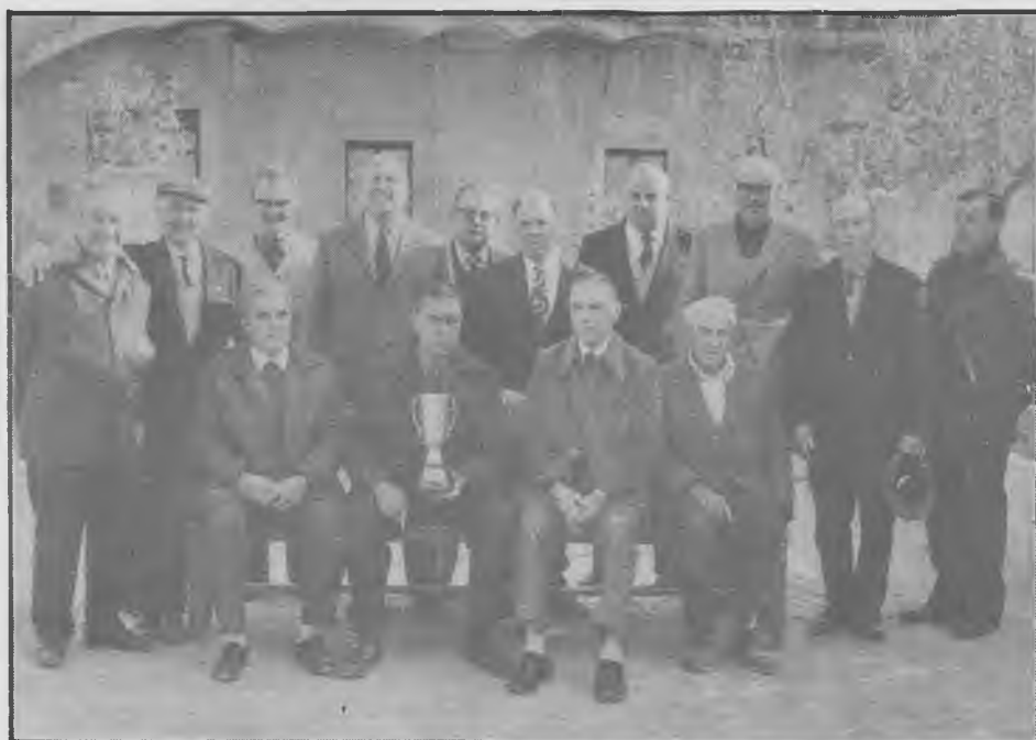
Els pioners de la petanca a Salt.

L'any 1977, amb motiu dels campionats Provincials, el Club assolí