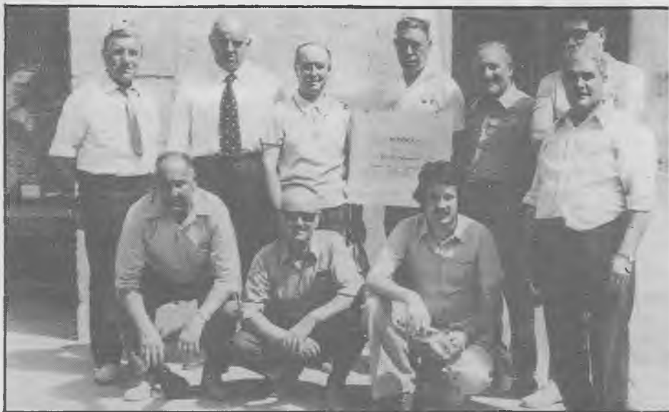
La segona Junta Directiva del Club petanca.