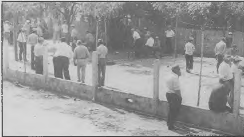
Un dia de Campionat a les nostres pistes.

Aquest any val a dir que els nostres jugadors no tindrien la sort de cara, doncs si bé els trofeus aconseguits han estat molts, els més importants s'han perdut.