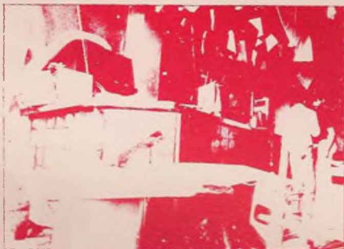
Ni goma-2 ni dinamita; els gasos de betzina i alcohol que hi havia en unes ampolles van provocar l'explosió de la matinada del dijous dia 20

A aquest resultat es va arribar afur després de totes les investigacions dutes a terme per funcionaris del Cos superior de Policia de Girona que durant tots aquests dies han anat analitzant les restes del bar i els efectes causats en el local i edificis del costat. S'ha arribat a la conclusió que no hi intervingué pas cap artefacte, ja que no se'n van trobar restes ni tampoc es descobrí cap tret ni en principi s'hauria