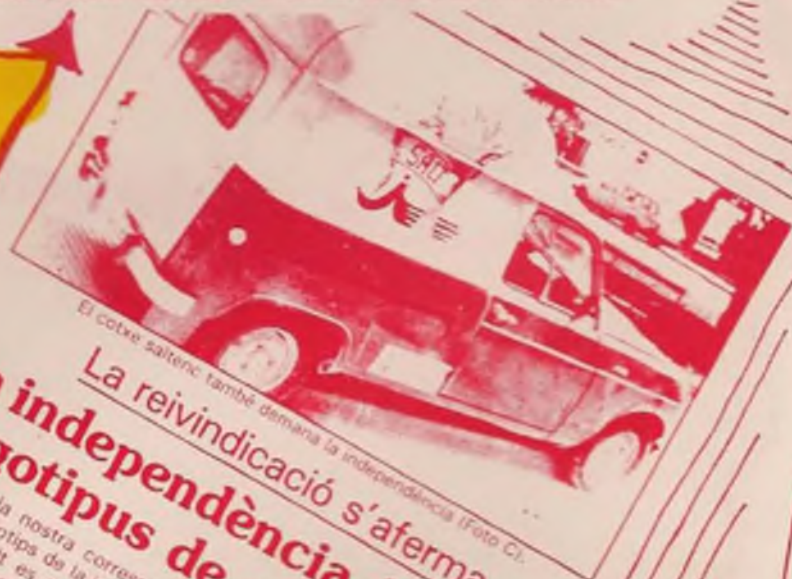
El cotxe saltenc també demana la independència.

Era la 1 en punt de la matinada. La Plaça de la Llibertat plena de gent. Era tot un espectacle. Bombers, guàrdies de l'Ajuntament, —els civils varen ésser els últims, al cap d'una hora i pistola en mà—. Tot eren comentaris sobre la forta explosió. Però ningú sabia res del que havia passat. I ara ens preguntem: ho sabrem algun dia?