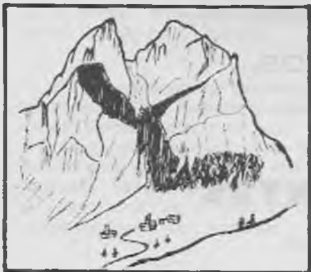
Saldes i el Pedraforca

Un dia, al capvespre, tres nois i jo ens dirigim envers un camí encatfat d'un verd flonjós, pel bell mig d'un bosc exuberant que ens mena cap al refugi Estasen, la porta del qual era plena de jovent contemplant l'immens mur de roca que s'aixeca davant mateix. Una esquerra de sol encara il·lumina els cims de la gran muralla calcària. L'estança estava curulla de gent i decidim bivaquejar un xic més amunt, camí de la canal del Verdet. La Bauma de les Orenetes va ésser el nostre aixopluc. Un fort vent ens acompanyà tot el camí. Ens instal·lem. Sopem. Una rispa gelada ens feu anar de pressa per ficar-nos dintre els sacs. Una nit estrellada sobre nostre. El vent esbufegajant pel mig de les branques dels avets,