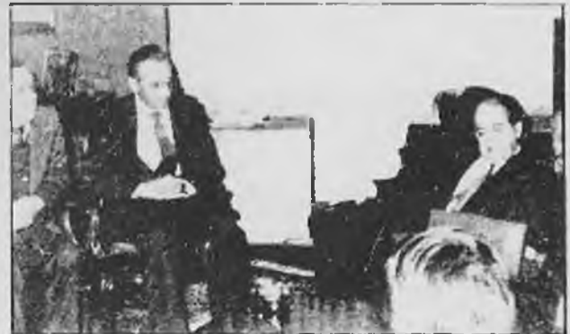
El President de la Generalitat va prometre a la Comissió l'Independència de Salt que s'agilitzaran els tràmits quan l'expedient arribi a la Plaça de Sant Jaume

D'altra banda, sembla que la setmana que ve es farà l'exposició pública de l'expedient de segregació de les dues antigues vil·les Maigral totes les dificultats, es pot afirmar que aquesta lita lligament buscada, per Salt i Sarrià, es podrà veure realitzada.