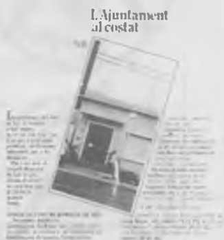
Cap ves de Salt no ha d'anar al centre a resoldre els seus problemes.