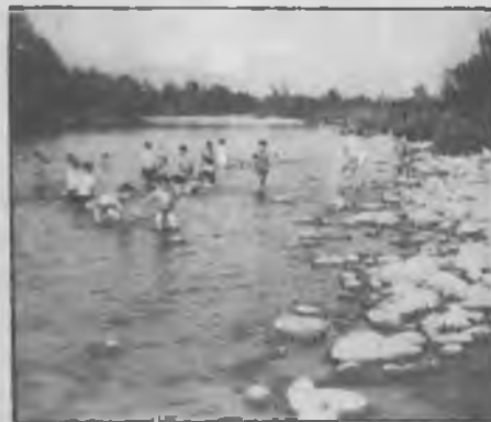
El riu Ter al seu pas per Salt, el temps en què encara ens hi podíem banyar.

En els escrits que ha fet públic la Comissió per la Independència, s'endevina que és una qüestió que els preocupa. Aquesta Comissió d'entrada, hauria complert el seu mandat una vegada convocades les eleccions municipals... però els preocupa aquest futur, i per això intenten promoure tota mena d'estudis que serveixin de base al nou Ajuntament.