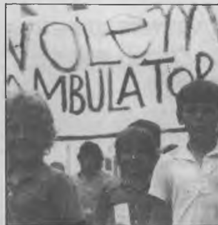
Primera manifestació autoritzada a les comarques gironines; a Salt, campanya "Volem un ambulatori" organitzada per l'Associació de Veïns. Any 1976.

És una documentació feta amb pressos, compleix ben just el compromís d'aquest amb la Comissió d'Independència. Hi ha molts errors de càlcul, que denoten una falta de rigor en l'elaboració. La proposta que es fa diu: "La independència municipal NO ÉS LA ÚNICA solució". Com podem endevinar, la incògnita està en saber quines són les solucions proposades.