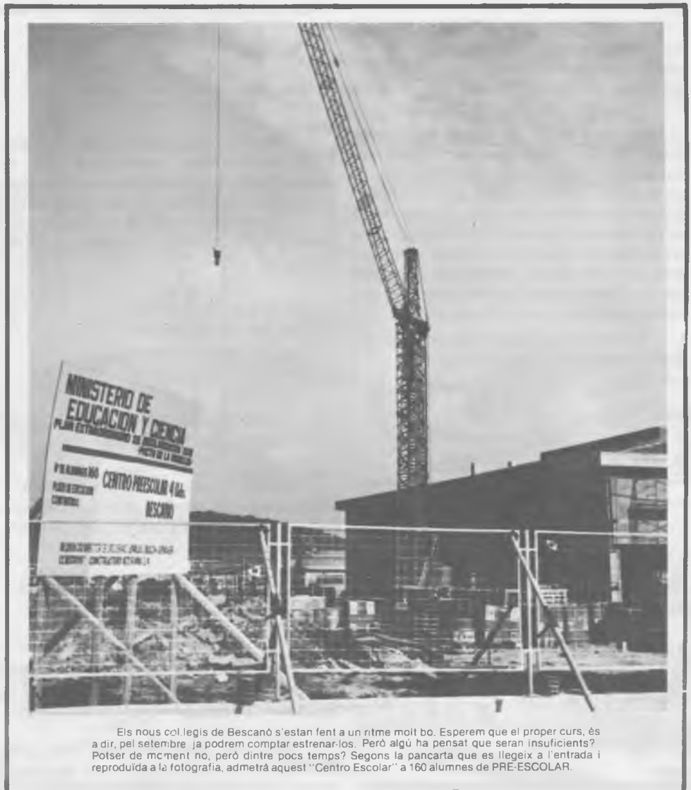
Els nous col·legis de Bescanó s'estan fent a un ritme molt bo. Esperem que el proper curs, és a dir, pel setembre ja podrem comptar estrenar-los. Però algú ha pensat que seran insuficients? Potser de moment no, però dintre pocs temps? Segons la pancarta que es llegeix a l'entrada i reproduïda a la fotografia, admetrà aquest "Centro Escolar" a 160 alumnes de PRE-ESCOLAR.