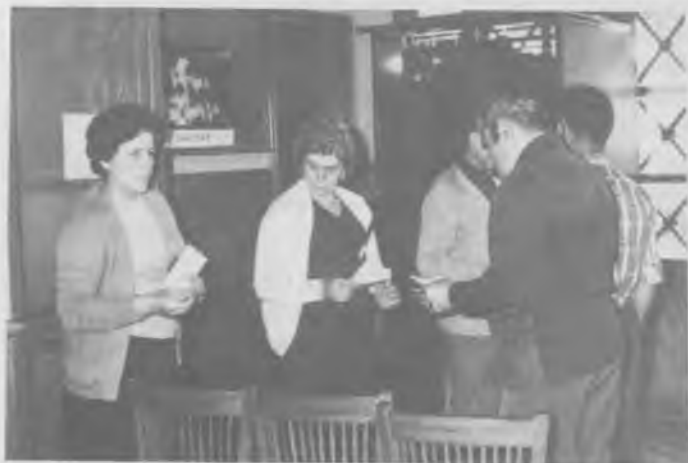
Els bescanonins s'ho pensen a l'hora de donar el seu vot.