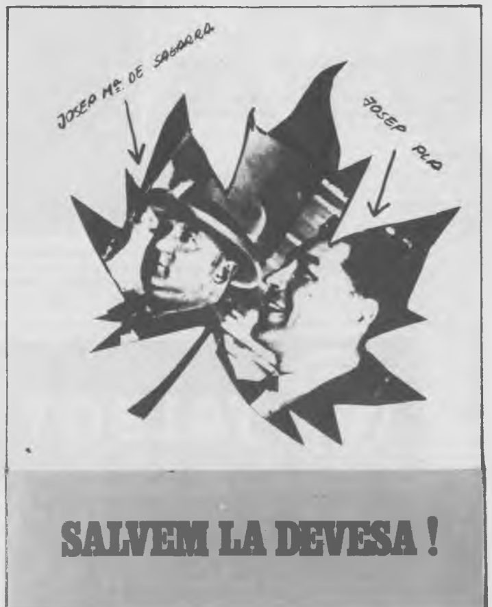
Foto-Composició. Damunt l'adhesiu de la campanya "Salvem la Devesa" feta a l'octubre-novembre del 76 per l'Assemblea Democràtica d'Artistes de Girona.

Aquest troç que heu llegit pertany al capítol que fou publicat al N.º 3 del setmanari "L'OPINIÓ", amb el títol "Les pedres de Girona"