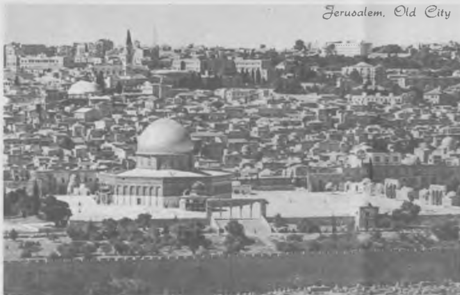
Jerusalem. Old City

Vaig prendre part en el pelegrinatge diocesà de Girona a Terra Santa aquest agost passat, i a més de les visites als llocs sants, (que podrien ser exposats en una xerrada amb diapositives) vam veure l'estat polític i econòmic del País, i la organització d'una granja o explotació de tipus col·lectiu. Però no com en les Repúbliques Socialistes, imposat per l'Estat, sinó aquí amb l'ingrés voluntari dels seus membres i amb una organització autònoma per cada KIBBOUTZ.