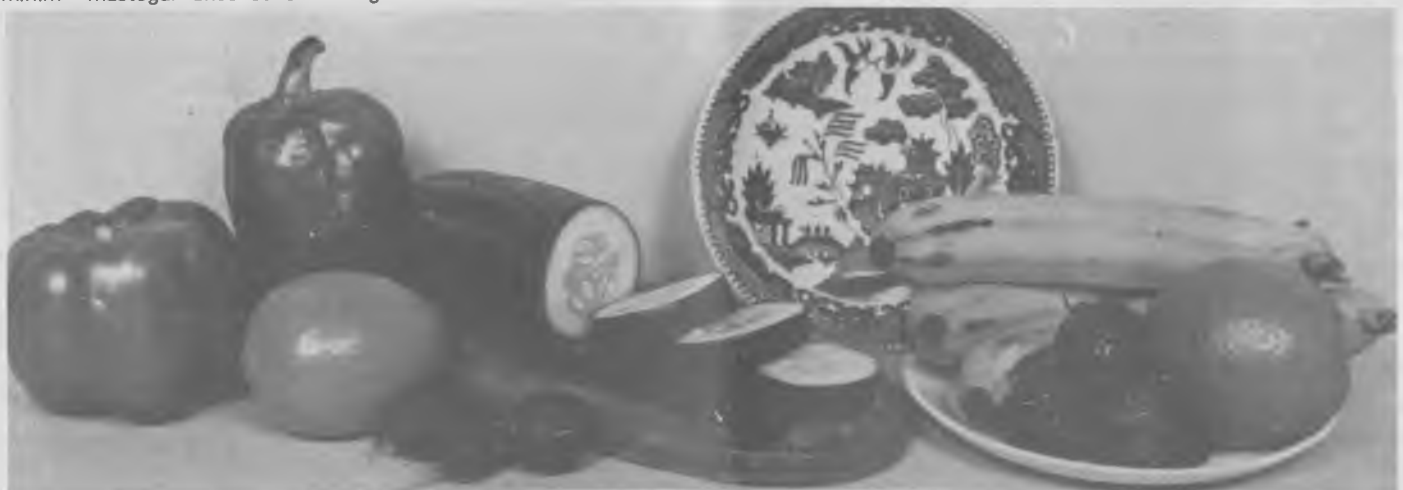
El càncer pot ser degut a un desequilibri per excés de líquids i fruites (YIN) o excés d'albúmines i d'altres productes forts i pesats (carn, ous, lactis, picants, ) L'equilibri és la solució.