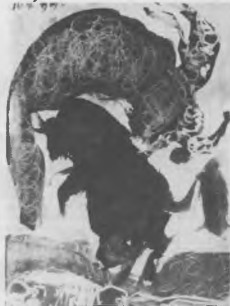
Dibuix realitzat l'any 1959 amb tinta xinesa i llapis de colors per Pablo Ruiz Picasso.

Encara més antigament, en el Fuego de Cuenca de l'any 1.189 ja hi trovem: "Qual quiere que a otro dixere malato o cornudo, peche dos si fuere prouado, et sobresto jure con dos vezinos que non sabe mal enel". També en Gonzalo Correas en el seu "Vocabulario" de Refranes ens diu que el cornut té relació amb el cucut "Ke este páxaro dizen ke buska los nidos axenos, i se kome los huevos i pone allá los zuios, i las otras aves le krian los hixos."