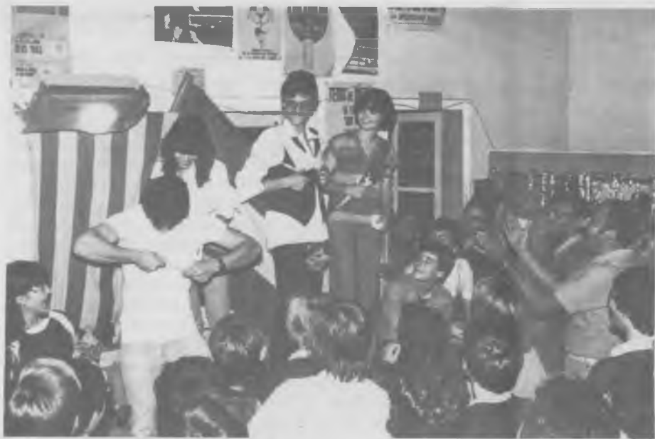
Les Pubilles i Pubills després de la seva elecció. Ells es proven els regals amb que foren obsequiades les pubilles.

Podem veure l'entusiasme amb què alguns dels nostres "marxosos" consellers aplaudeixen l'acte.