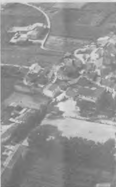
Un moment del partit celebrat el passat diumenge dia 21 d'octubre, entre el Bescanó i el Sant Roc d'Olot, des d'una altura de tres cents metres sobre el camp. El resultat va ser favorable al nostre equip.