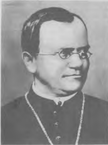
Gregor J. Mendel (1822-1884)

Avui dia sembla que les paraules rares s'imposin i ens allunyin de la realitat, fent que allò que ha estat un fet evolutiu, espontani i natural, es torni com inaccessible per a nosaltres. I em refereixo per exemple quan parlem de la Genètica. Genètica, diu el diccionari, és la part de la Biologia que tracta de la variabilitat i transmissió de l'herència. Espontàniament s'observa que en la multiplicació de les espècies vegetals i animals, com també en l'home, els individus fills s'assemblen als pares.