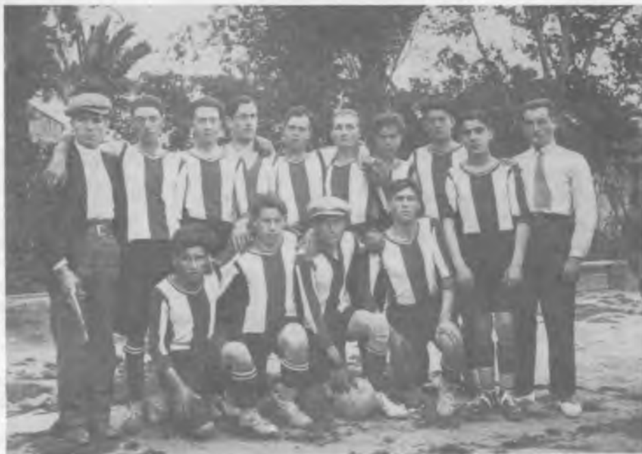
Dacord amb el publicat a la revista n.º 9, passem a detallar la identitat de cadascun dels jugadors de la foto presentada.

3-5 Coma-Cros - ALBA BESCANONINA. 10-5 ALBA BESCANONINA - Coma-Cros.