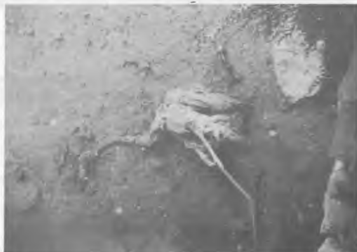
Flamenc mort a la Manga del Mar Menor. Pocs que n'hi han i encara es moren...

L'importància de les Tables radica en què han confluït varis factors, el sòl i l'aigua, el vent i la pluja, el sol i el temps. La vegetació és la típica dels aiguamolls, valques, canyes i tamarius i a les voreres alguna alzina, oliveira i cereals. I en quant a fauna s'ha de destacar el gran nombre de poblacions d'ànecs d'aigua, el més comú el Coll Verd, i els menys representats l'ànec Vermell i el Xocolater; la Fotxa, alguns ocells limícols, és a dir, que crien vora els pantans, al mig del fang.