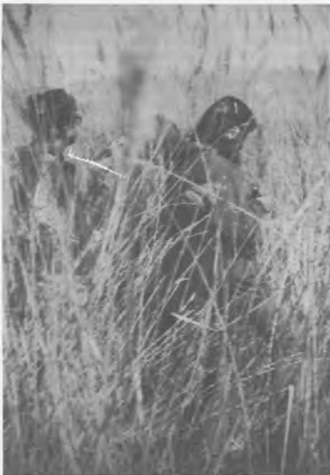
Observant cautelosament els ànecs... La vegetació és tan alta com nosaltres.

Considerant el conjunt de les àrees humides d'Europa i Nord d'Àfrica i tinguent en compte que en la zona mediterrània (Espanya, Itàlia, etc.) i Àfrica, el nombre de parcs salvatges d'aquesta categoria que existeixen són pocs (són països secs), el fet de que Las Tablas de Daimiel sigui un dels 10 (només 10 per desgràcia) parcs nacionals espanyols, té una gran importància. Representa un lloc d'hivernada de poblacions d'aus que venen dels països nòrdics i que són migradors, àrea de cria d'espècies que no viatgen i "habitats" de grups concrets que no troben més cap el nord condicions per viure.