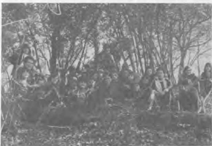
Els acampats i els seus monitors al cim d'una de les muntanyes més altes dels voltants de "El Sobirà"