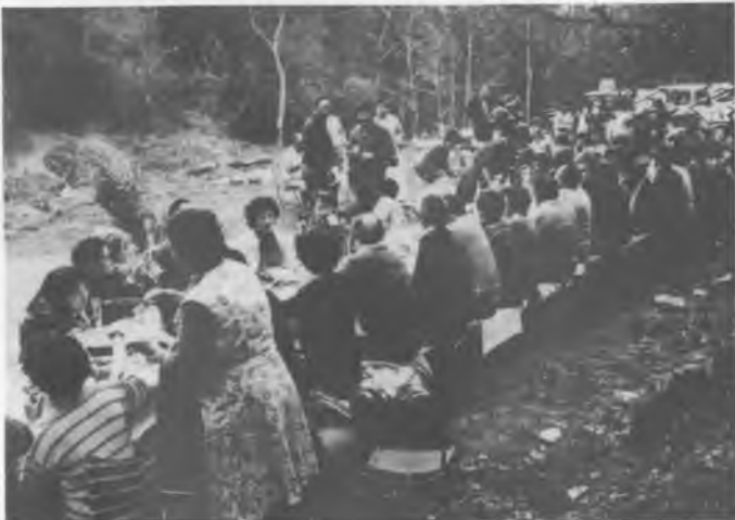
Vista general de l'aspecte que presentava el dia del dinar.

Secció: RELACIONS PÚBLIQUES de CONVERGÈNCIA DEMOCRÀTICA DE BESCANÓ.