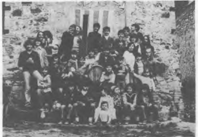
La mainada convergent que va assistir al dinar.