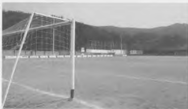
Vista de les tanques metàl·liques que s'han instal·lat a la paret frontal del camp.