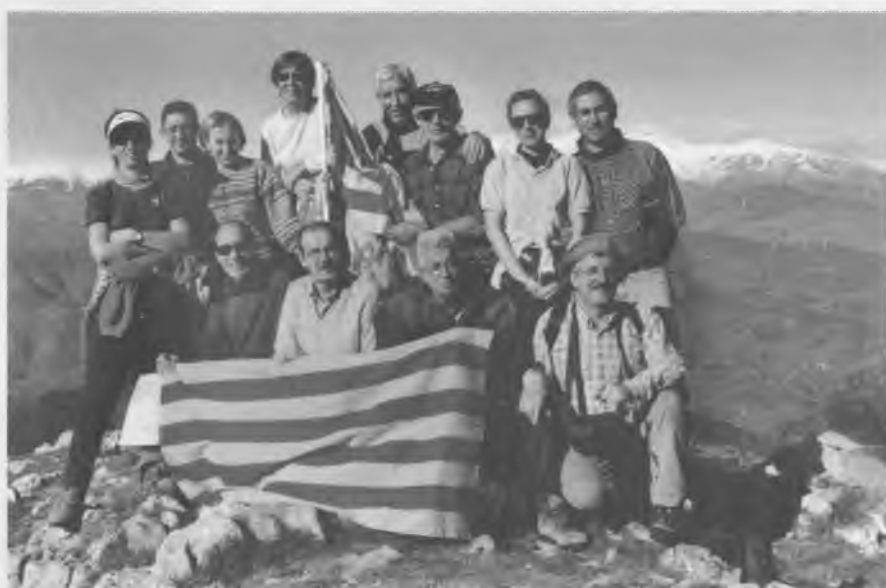
Membres de la Colla al cim del Bassegoda.