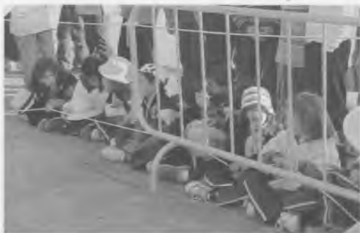
I ara què passarà...