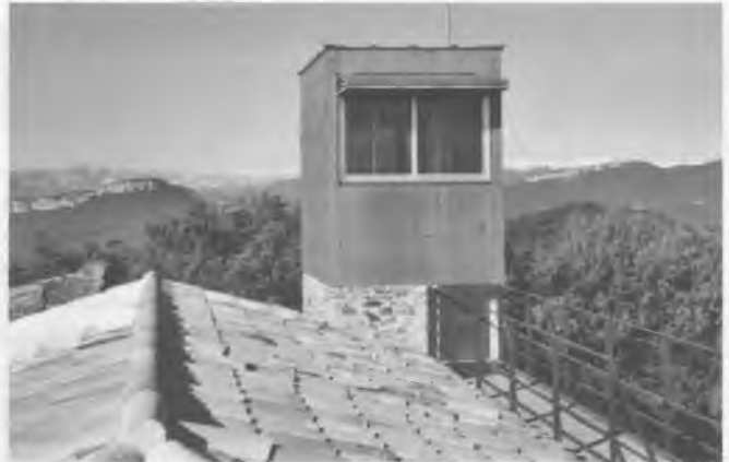
La torre de vigia que hi ha al cim de Sant Grau.