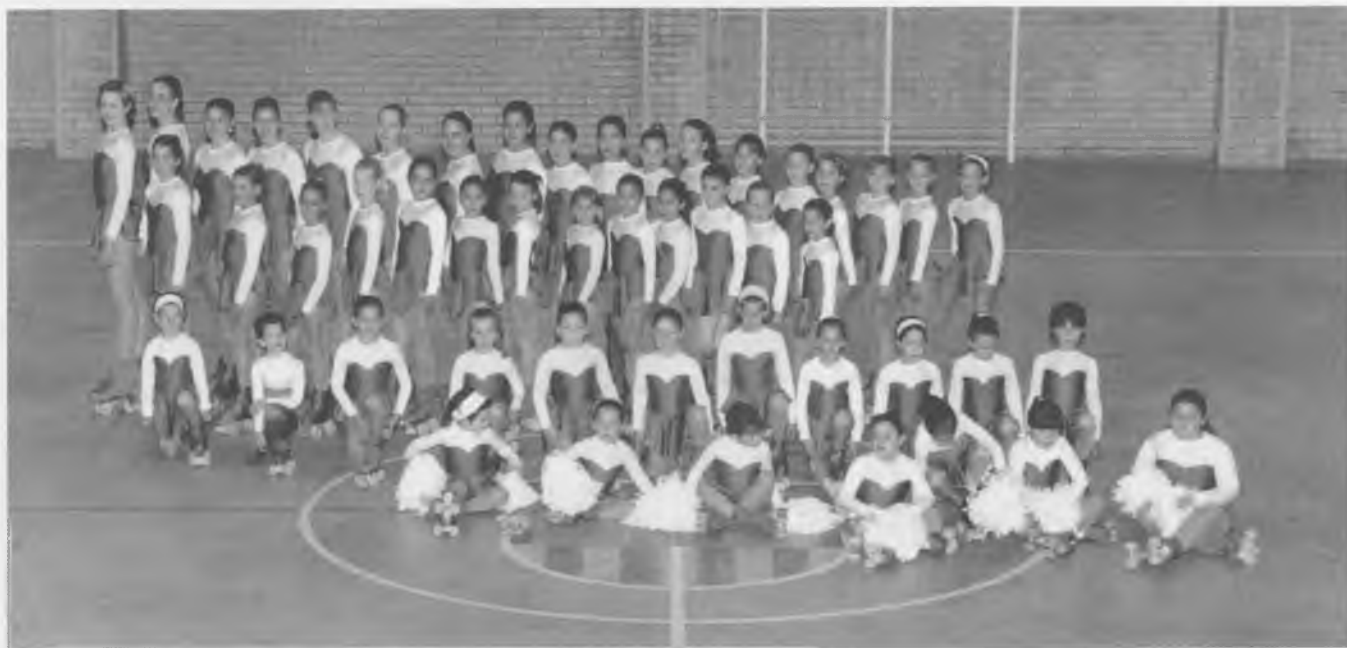
Patinadores del nostre club que van participar en la VIII Trobada de Patinatge de Bescanó el 24 de gener del 2002.