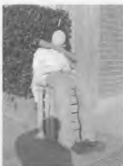
El nostre Carnestoltes, no sap què li espera..