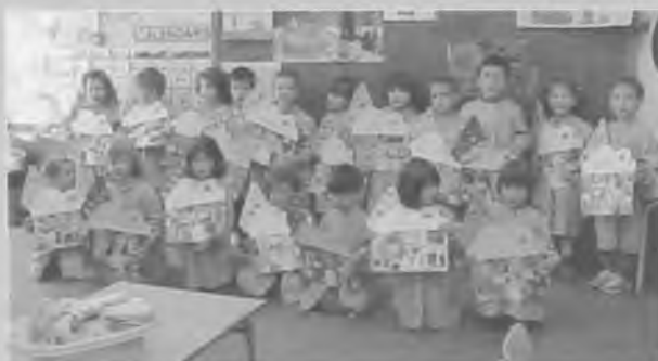
Aquests són els de P-3 "A" i "B" amb les seves cases. Han fet un mosaic de La Pedrera.