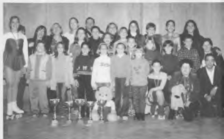
Participants en el Campionat de debutants celebrat a Celrà el 9 de desembre de l'any passat.