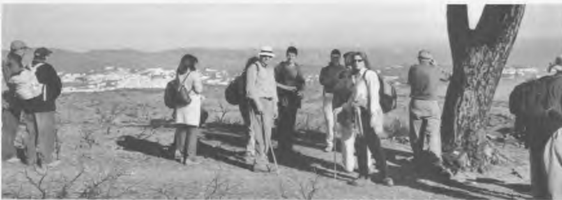
Una part dels membres de la Colla que van fer la caminada fins a Cadaqués.