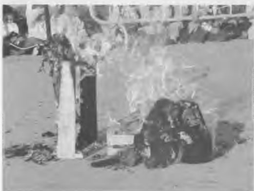
Pobre Carnestoltes... s'acaba de morir...

Com cada any, ens ha visitat en Carnestoltes, però el pobre Carnestoltes no recorda que nosaltres també, com cada any, l'acabarem acusant de totes aquelles coses que no ens agraden i tot i no ser Sant Joan, farem una bona foguera amb ell al mig. Però vaja, en aquesta foguera no hi haurà ni petards ni coets. El protagonista de la festa serà ell. Aquí podeu llegir el discurs de presentació.