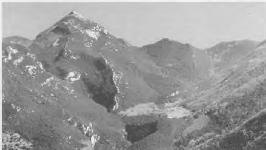
La Vall de Riu i el Puig de Bassegoda.