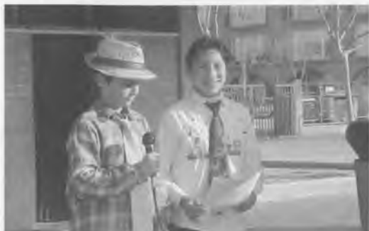
Els presentadors de la festa