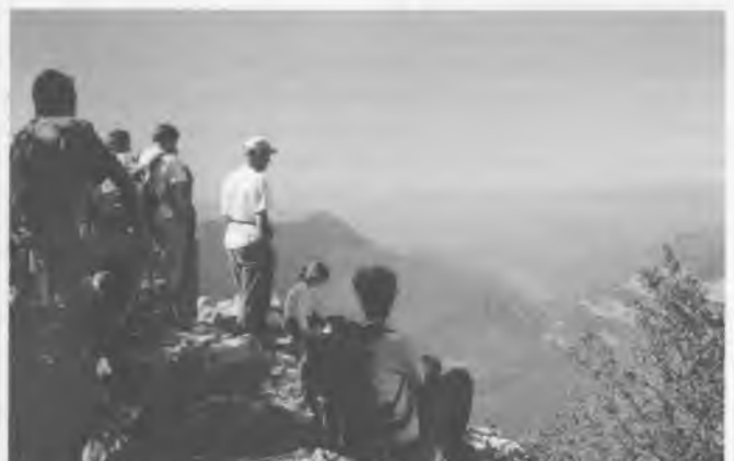
Membres de la Colla al cim del Puig Ferran.