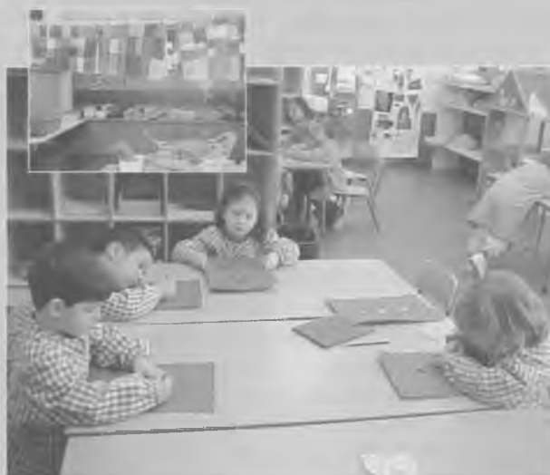
Aquí podeu veure'n d'altres punxant el paper per fer una vidriera de colors i al costat hi ha més mosaics de colors fets amb ceres.