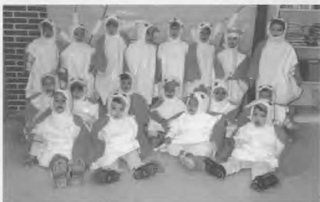
Foto de grup dels nens i nenes de la Llar d'infants disfressats d'ànecs per Carnaval.