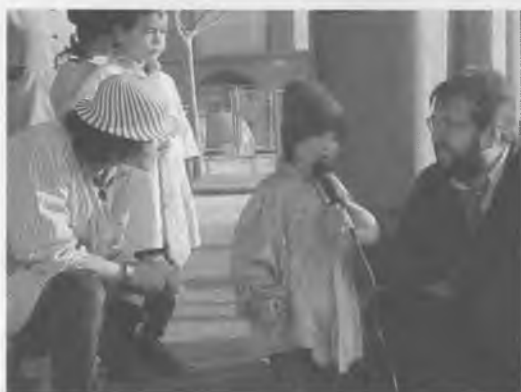
I nosaltres t'acusem de què...