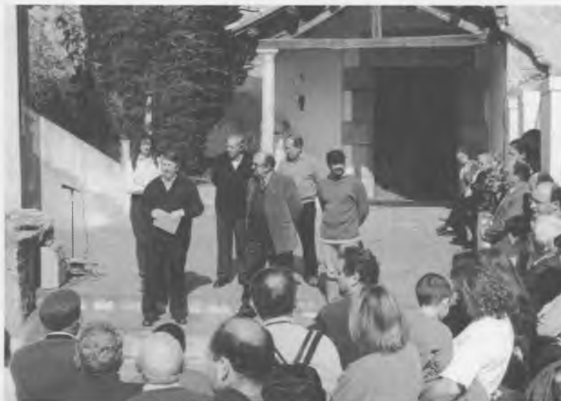
Intervenció de l'alcalde Xavier Soy durant l'acte de presentació del llibre.