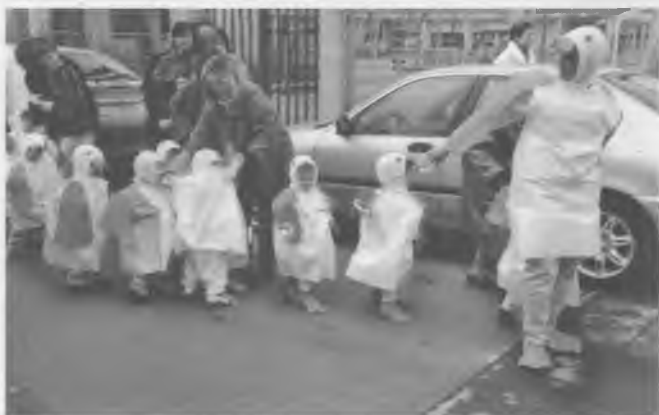
La mainada de la Llar d'infants disfressats d'ànecs passejant pel carrer.

Hola, som les tortugues i els pollets de la Llar d'infants Bescanó-Nins, aquest és el primer curs que fem sencer a la nova escola.