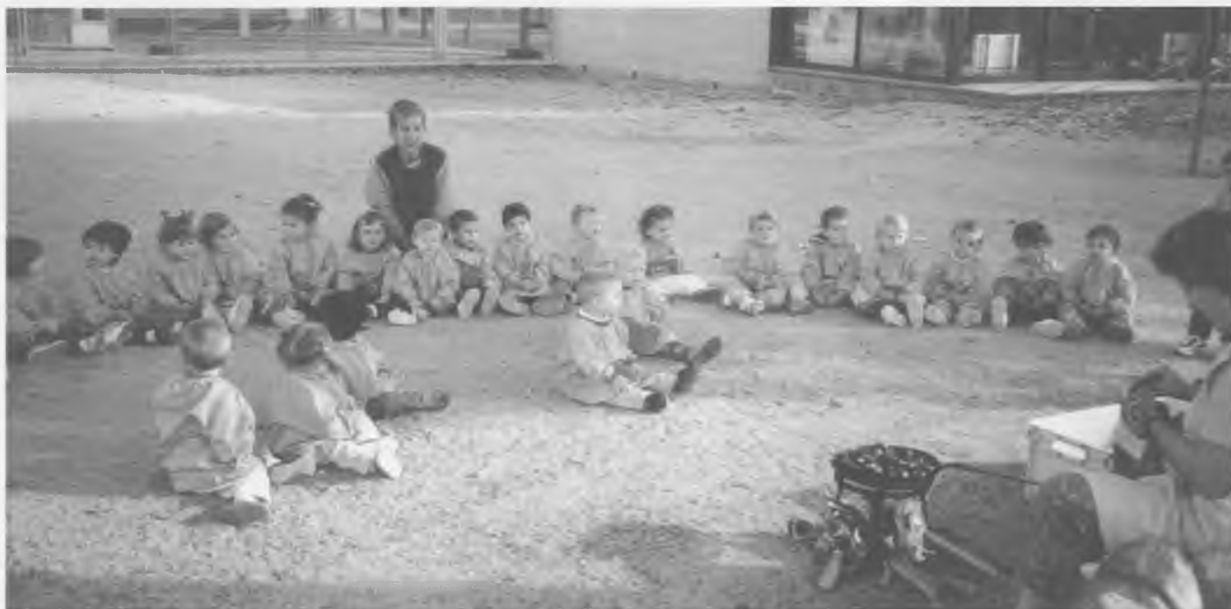
La mainada de la Llar d'infants celebrant la castanyada.