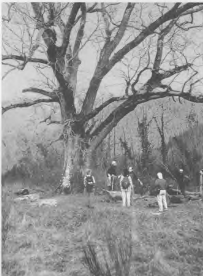
Un dels roures de la Vall d'Hortmoier.