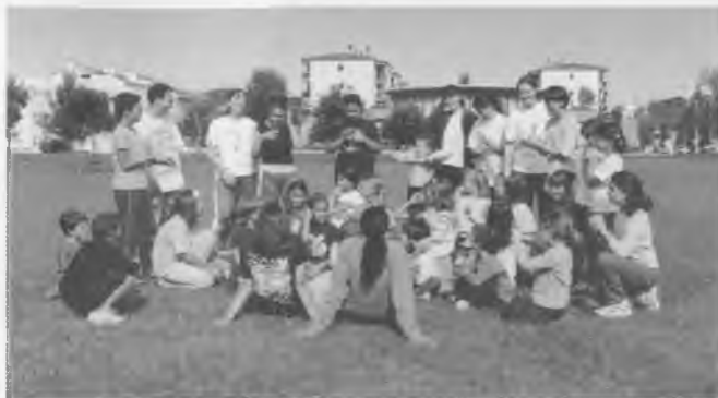
Jornada d'esbarjo a l'aire lliure que es va fer als voltants del pavelló el 21 d'octubre del 2001.