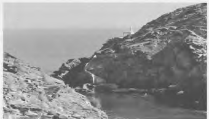
El bonic racó del far de Cala Nans.