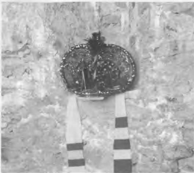
Detall del pessebre que vam portar a Sant Grau el 16 de desembre.