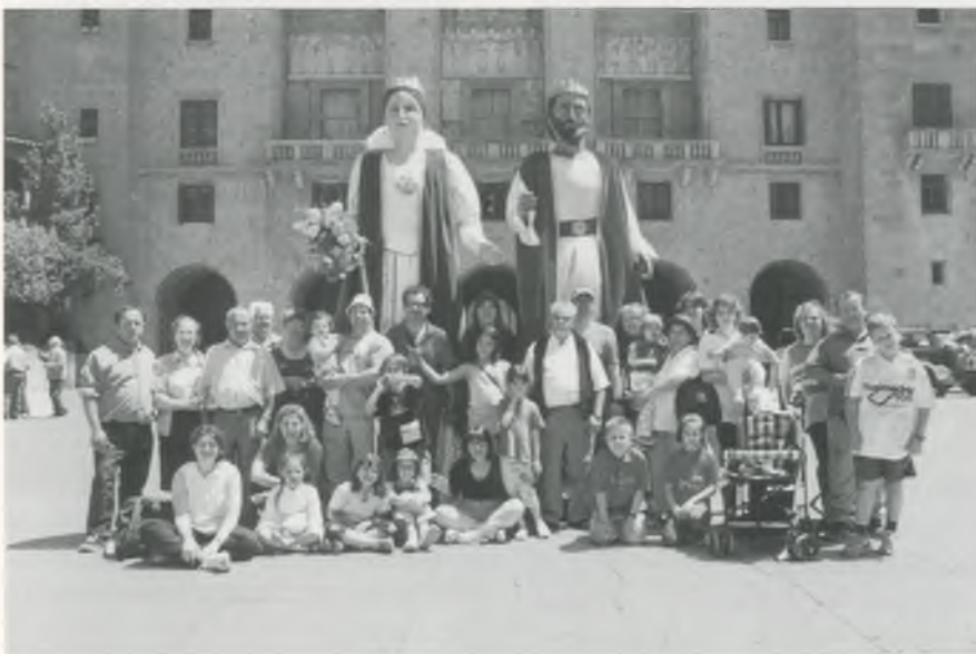
Els gegants de Bescanó a Montserrat. Foto de grup dels participants a la sortida a Montserrat organitzada per la Colla de geganters i grallers de Bescanó.