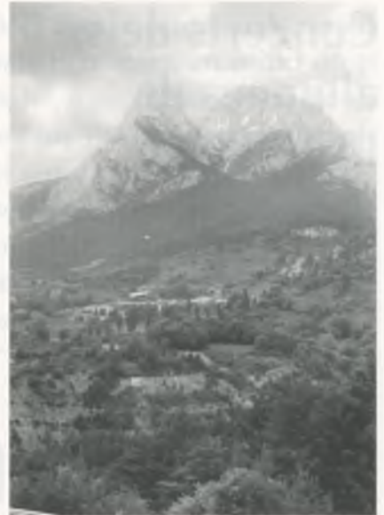
Vista del Pedraforca (2.497 metres).