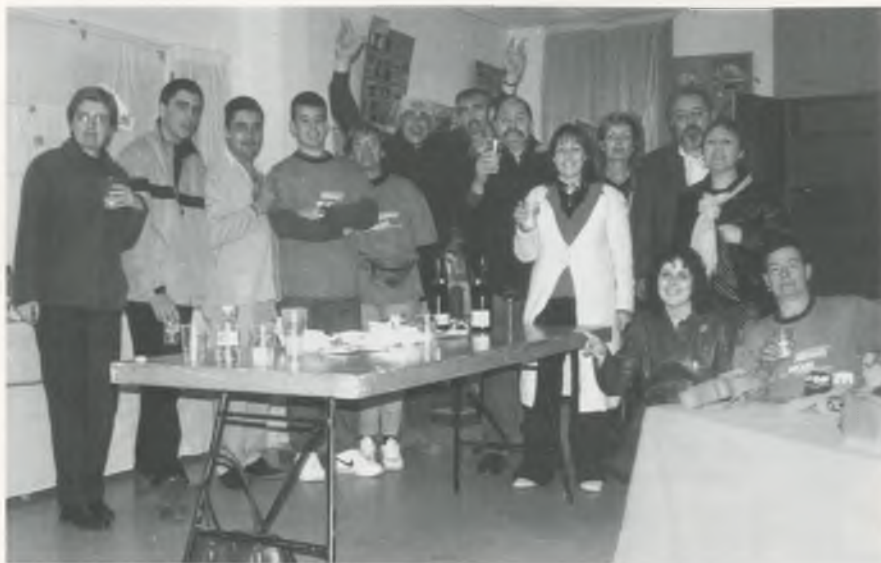
Colla de col·leccionistes i col·laboradors de l'edició d'enguany de Porkomania.