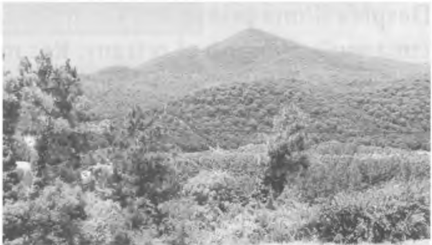
La muntanya de Sant Grau.

1H. 35 MIN. A l'esquerra es pot agafar la drecera que, amb molta pendent, puja directament al cim. Jo, particularment, prefereixo seguir per la carretera, ja que ara comença la part amb més ombra i boscos de castanyers.