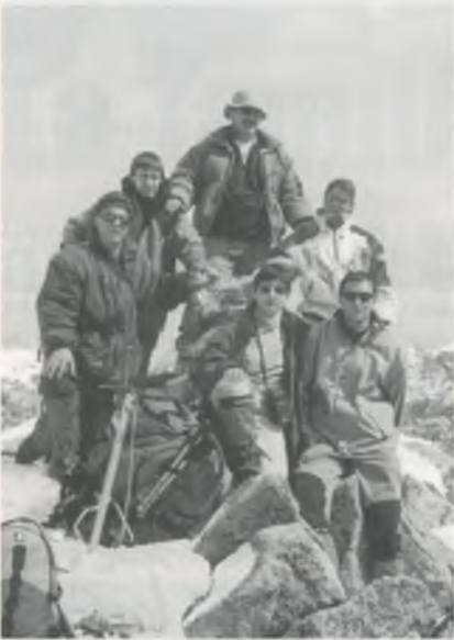
Membres de la Colla Excursionista l'Isard a dalt del Tuc de Ratera.