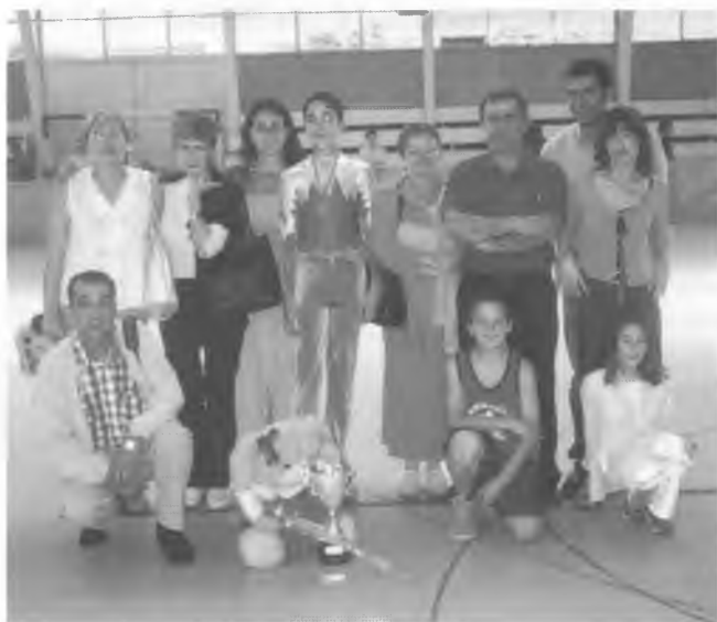
La representació del C.P. Bescanó en el Campionat Provincial Cadet que es va fer a Palafrugell els dies 25 i 26 de maig.

Catalunya de la categoria que es va fer a Santa Coloma els dies 8 i 9 de juny. En aquest campionat va aconseguir el 3r lloc i el passaport per disputar el Campionat d'Espanya Cadet, que es feia a Cangas (Galícia) els dies 28, 29 i 30 de juny.