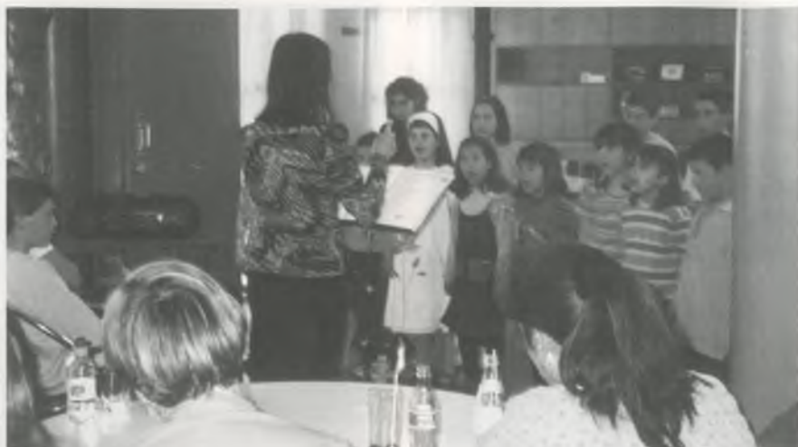
Un moment de l'actuació que els alumnes de l'Escola de Música de Bescanó van fer al Casal d'Avis per la diada de Sant Jordi.

Per altra part, el passat 14 de juny, amb motiu del dia internacional de la música, els alumnes de l'Escola