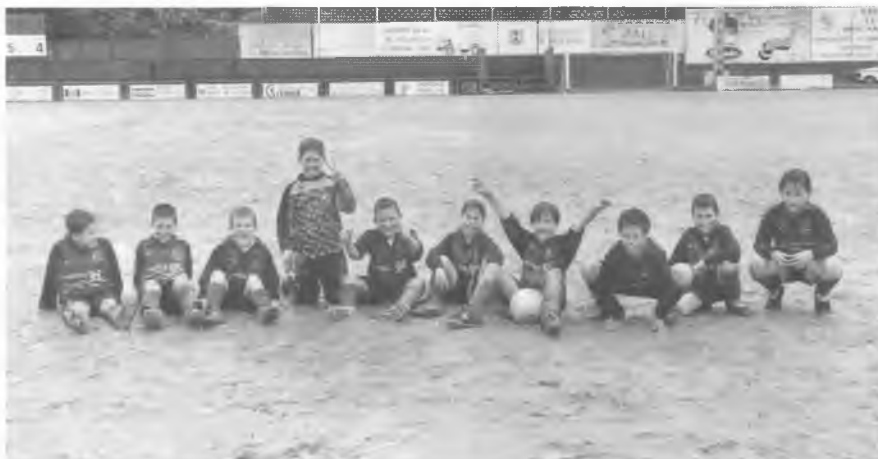
L'equip benjamí A del C.E. Bescanó, que enguany ha guanyat la Copa Consell (C.T.G.).