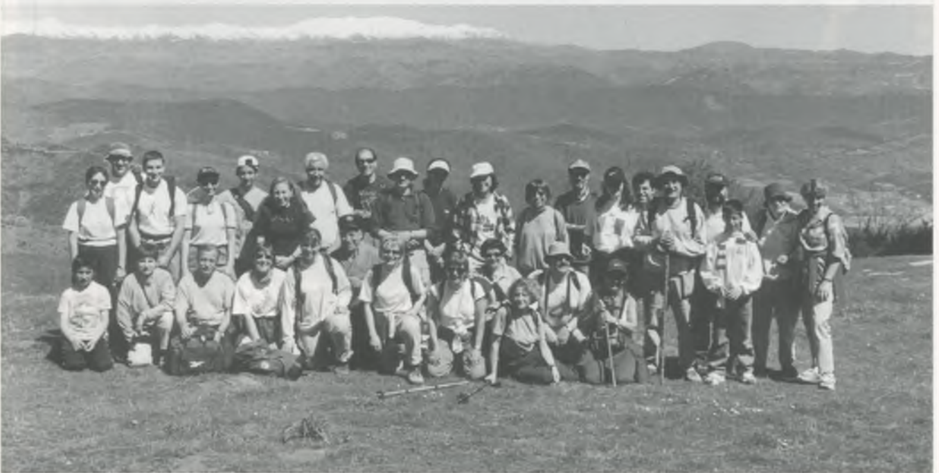
Foto de grup dels isards que el mes de maig van pujar al Puigsacalm.