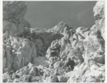
Membres de la Colla l'Isard enfilant-se per les roques del Pedraforca.