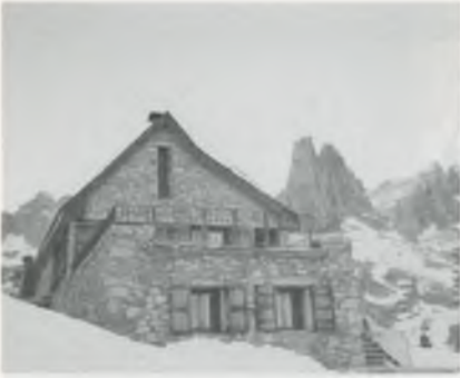
Refugi i agulles d'Amitges.