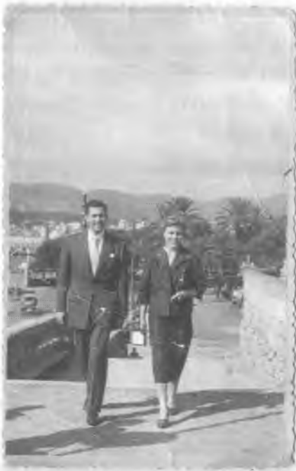
El matrimoni durant les vacances que van passar a Mallorca l'any 1955, al vendre el cafè que tenien a Roses.

amb carros carregats de sacs plens de blat de moro per fer farina panificable i d'altres cereals per fer farinades per al bestiar. "Les farinades per al bestiar es feien tot l'any i la farina panificable es feia d'agost fins a final d'any, de manera que el meu pare tenia molta feina i havia de treballar de les 6 del matí fins a les 10 o les 11 de la nit, motiu pel qual tenia un mosso que s'encarregava de treballar la terra que tenia arrendada" , comenta la Joaquina, que recorda que "com sempre hi havia cues, els pagesos ja s'emportaven el menjar de casa seva per fer més passable l'estona que s'havien d'esperar, que gairebé sempre era de moltes hores" .