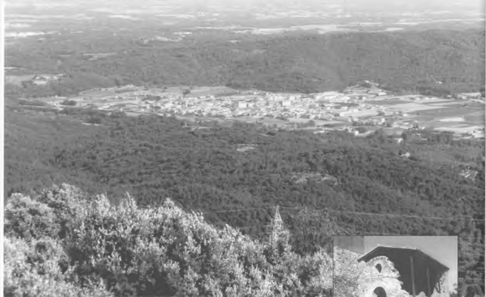
Vista de Bescanó des de Sant Grau. L'ermita de Sant Grau.