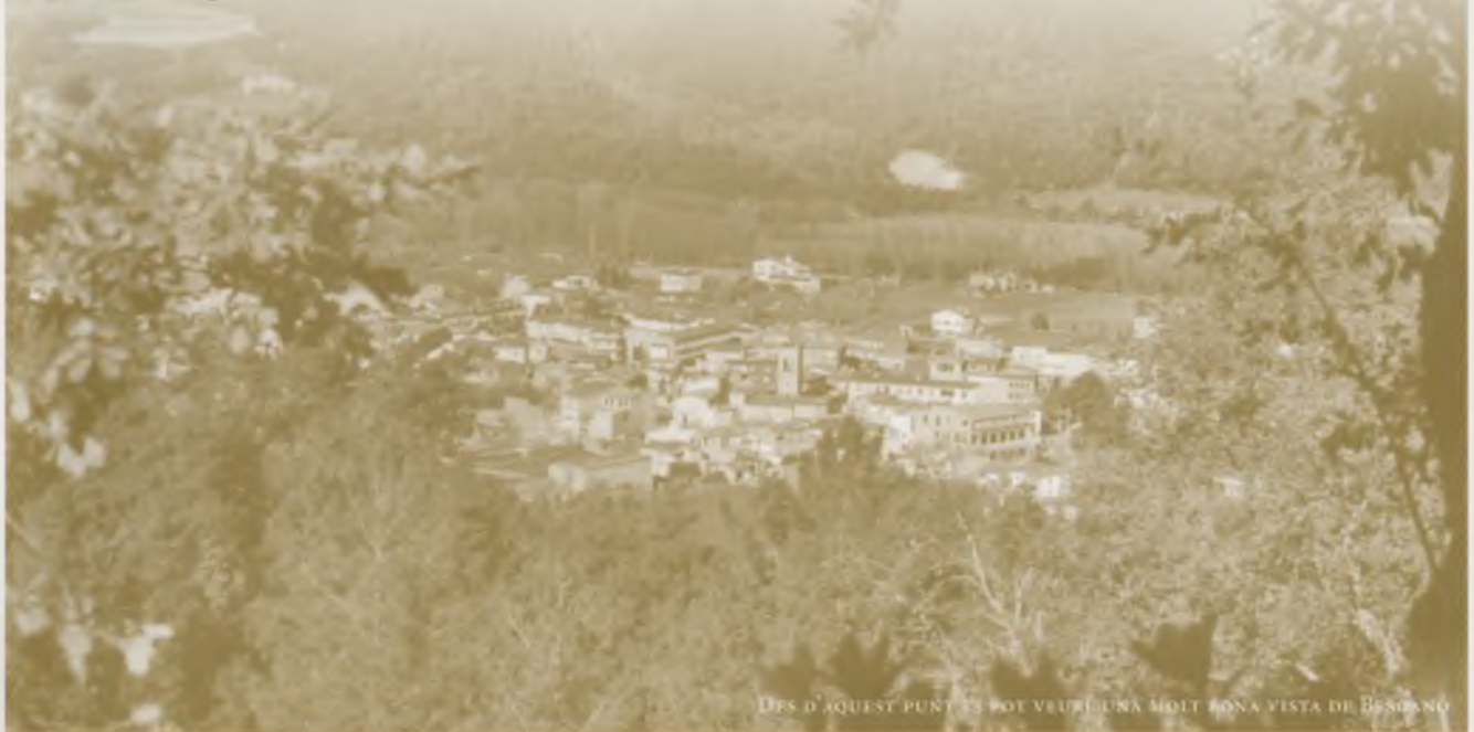
DES D'AQUEST PUNT ES POT VEURE UNA MOLTA BONA VISTA DE BESCANÓ

Hem de seguir baixant fins per la carretera fins que arribem al camí de les vall-lloberes, i de nou ja som a Bescanó (1 hora i 50 minuts).