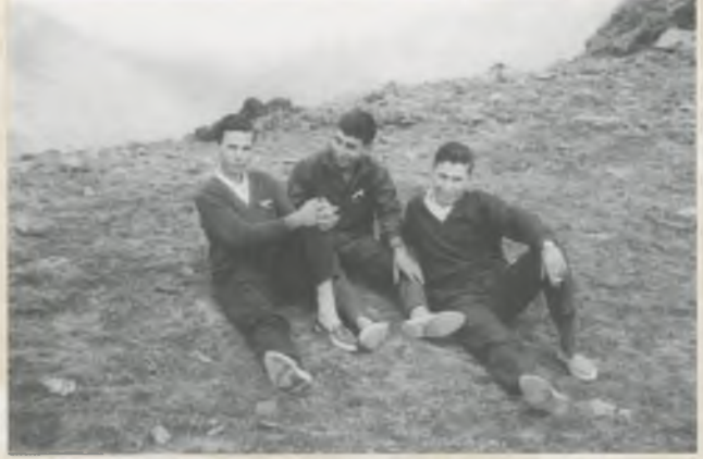
EXCURSIÓ A NÚRIA