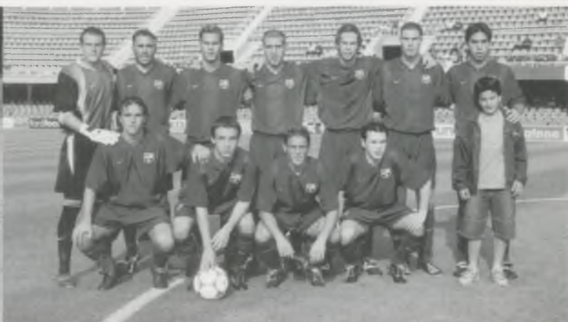
AMB ELS SEUS COMPANYS DE LA MASIA SEMPRE VAN FER UN BON EQUIP.