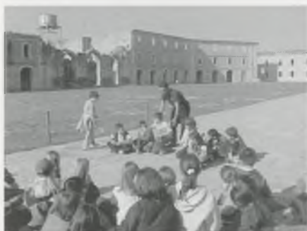
VAM FER UN JOC PER EXPLICAR COM ERA UN SETGE EN UN CASTELL