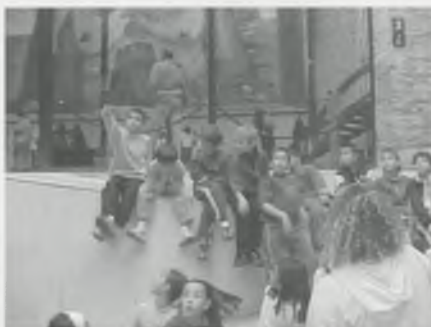
ESTEM MIRANT CAP A DALT. QUÈ ENS DEUEN EXPLICAR ?