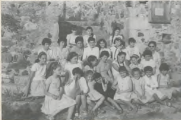
TROBADA DE CÒRS QUE ANAVEN A CATECISME