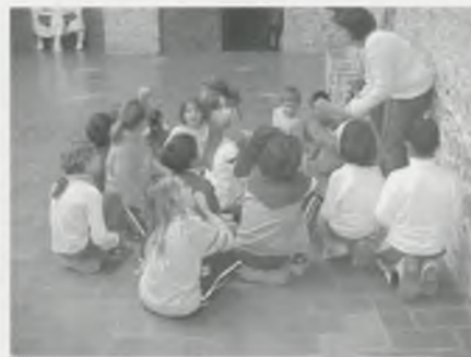
ELS DE 4T ESTEM ESCOLTANT LES EXPLICACIONS DE LA MONITORA A LA SALA DE LA CÚPULA DEL MUSEU