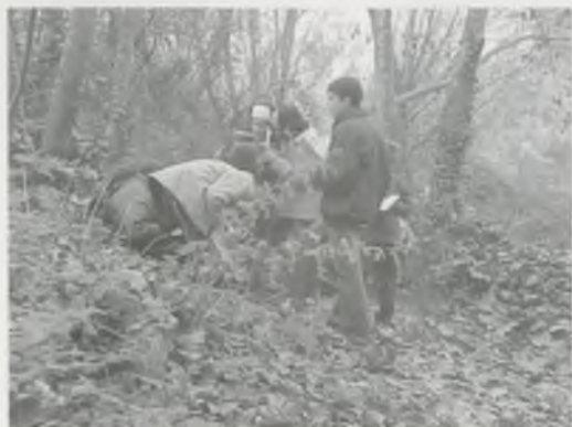
MIREM LA TEMPERATURA DE L'AIGUA (FOTO SUPERIOR) I ANOTEM EN UN QUADERN EL QUE OBSERVEM

El lloc no estava gaire net, ja que hi vam trobar llaunes, papers, bosses de plàstic, bosses plenes de deixalles i a més se sentia molt el soroll dels cotxes que passaven per la carretera. Ens van explicar que del soroll que se sentia se'n deia contaminació acústica.