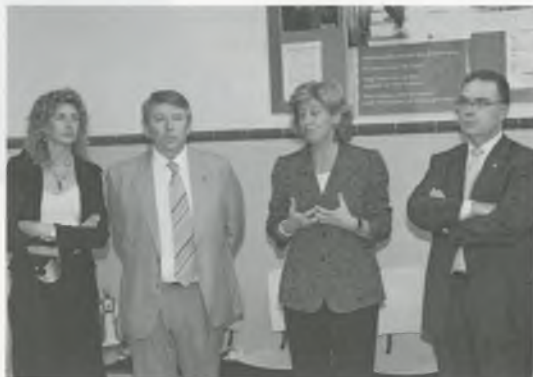
INAUGURACIÓ DE L'AMPLIACIÓ DEL CONSULTORI MÈDIC

LA CONSELLERA DE BENESTAR VA POSAR LA PRIMERA PEDRA I VA INAUGURAR L'AMPLIACIÓ DEL CONSULTORI I LA LLAR D'INFANTS