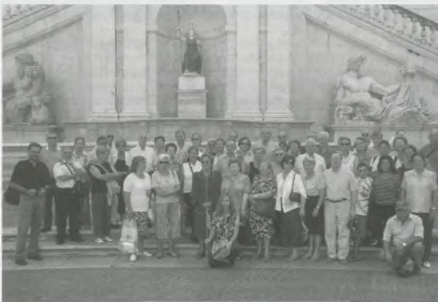
ELS 53 MEMBRES DE L'EXPEDICIÓ BESCANONINA A ROMA

Roma és una de les ciutats més conegudes per la seva riquesa cultural, històrica i religiosa, potser la que més. I lògicament un dels indrets més simbòlics és la Plaça de Sant Pere, un lloc sagrat fascinant. Allà ens va rebre el Papa Joan Pau II en audiència. En els seus tradicionals actes dels dimecres, el Papa va donar la benvinguda "al grup de la parròquia de Bescanó", nom que havíem donat en la inscripció. En sentir aquelles paraules, tots 53 vam esclatar a cridar i aplaudir. La Plaça de Sant Pere és una de les més famoses del món, i d'on sorgeix la Basílica del Vaticà, on vàrem poder contemplar la magnífica obra de la Pietat d'en Miquel Àngel i tota la resta, que és excepcional. Vam visitar els Museus Vaticans i la Capella Sixtina on Miquel Àngel va pintar el sostre amb fragments del Gènesi.