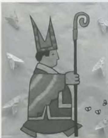
SANT NARCÍS I LES MOSQUES

Quan arriba la tardor, ens agrada veure les fulles d'arbres canviar el seu color, ens agrada anar a buscar bolets, ens agrada collir castanyes, ens agrada menjar-les i, és clar, també ens agraden els panellets. Encara que a la majoria de nosaltres el començament de la tardor ens fa pensar en les Fires de Girona, les parades i els Focs.