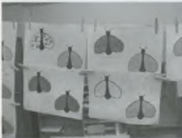
LES MOSQUES D'EDUCACIÓ INFANTIL