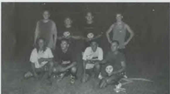
ELS GUANYADORS DEL BESCANONÍ DE FERRO