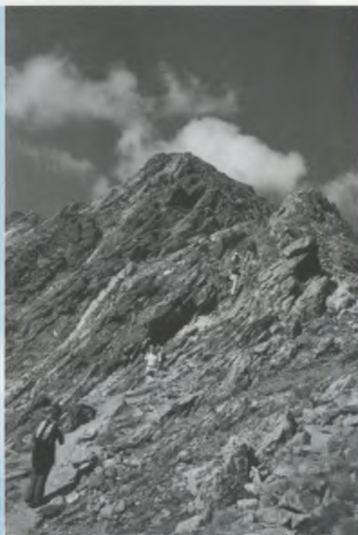
L'ASCENS CAP AL PIC DE L'INFERN

Un cop tots som a Núria, el temps aprofita per descarregar. Durant l'excursió hem tingut una mica de tot: sol, vent, núvols i trons, però no plou fins que tots som a l'Estació de Núria, a aixopluc. Des d'allà, agafem el cremallera per baixar fins a Queralbs, des d'on viatgem amb autocar fins a Bescanó (excepte els que hem recollit durant el trajecte) i arribem a les vuit del vespre.