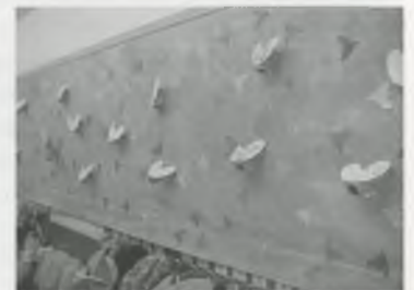
LES MOSQUES D'EDUCACIÓ INFANTIL