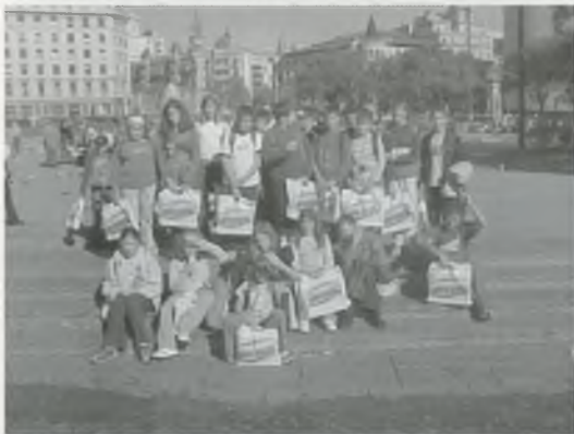
ELS ALUMNES DE 5È I 6È A LA PLAÇA DE CATALUNYA DE BARCELONA