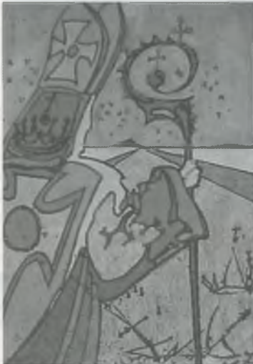
SANT NARCÍS I LES MOSQUES SEGONS DALÍ