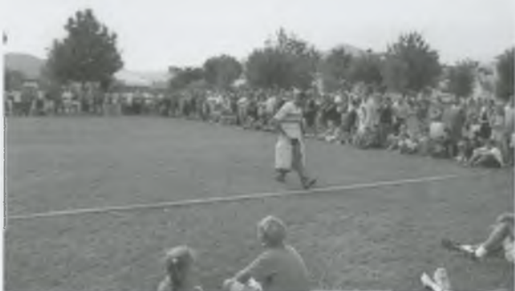
UNA DE LES PROVES DEL BESCANONÍ DE FERRO, QUE ENGUANY S'HA CELEBRAT PER PRIMER COP