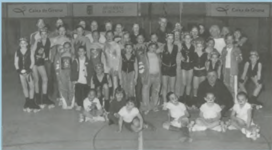
FESTA DEL CLUB DE PATINATGE DE BESCANÓ CELEBRADA EL 15 DE NOVEMBRE PASSAT