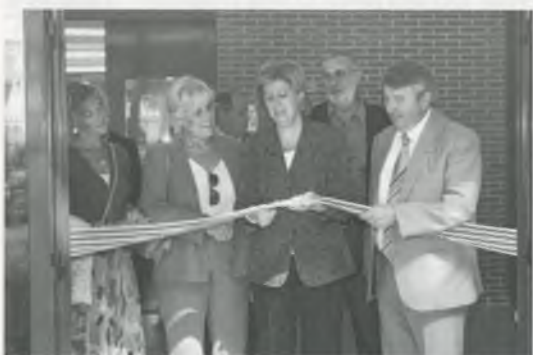
FINAL DE FESTA A L'ESCOLA BRESSOL