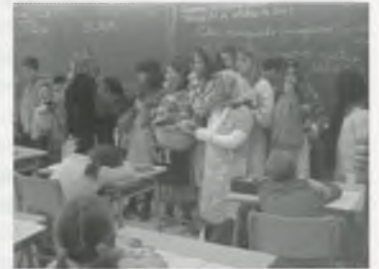
ELS CASTANYERS I LES CASTANYERES