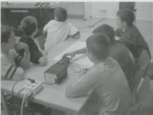
AL PALAU MACAI VAM PODER EXPERIMENTAR AMB DIVERSOS TALLERS

Ens va venir a buscar l'autocar i vam arribar a Besençó cap a dos quarts de set de la tarda