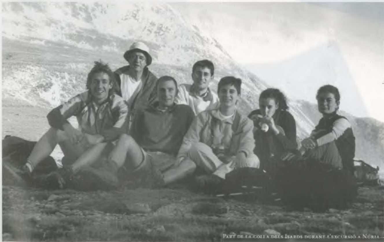
PART DE LA COLLADA DELS ISARDS DURANT L'EXCURSIÓ A NÚRIA