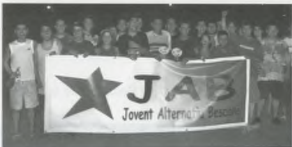
ELS MEMBRES DEL JAB, DURANT LA FESTA MAJOR D'AQUEST ESTIU