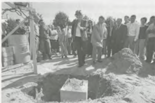
COL·LOCACIÓ DE LA PRIMERA PEDRA DEL LOCAL POLIVALENT

Les obres d'aquest equipament van començar el 28 de setembre passat després de l'acte simbòlic de col·locació de la primera pedra que va dur a terme l'aleshores consellera de Benestar i Família de la Generalitat, Irene Rigau. Durant el mateix dia, la consellera va inaugurar l'ampliació del consultori mèdic i de la llar d'infants.