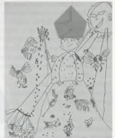
SANT NARCÍS I LES MOSQUES CICLE MITJÀ