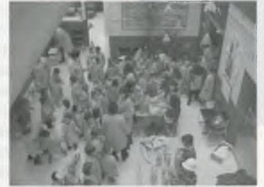
LA CASTANYADA A L'ENTRADA

Bé, i això és tot. En aquesta pàgina podeu veure una colla de fotos que us ajudaran a fer-vos una idea de com ha estat la tardor a l'escola.