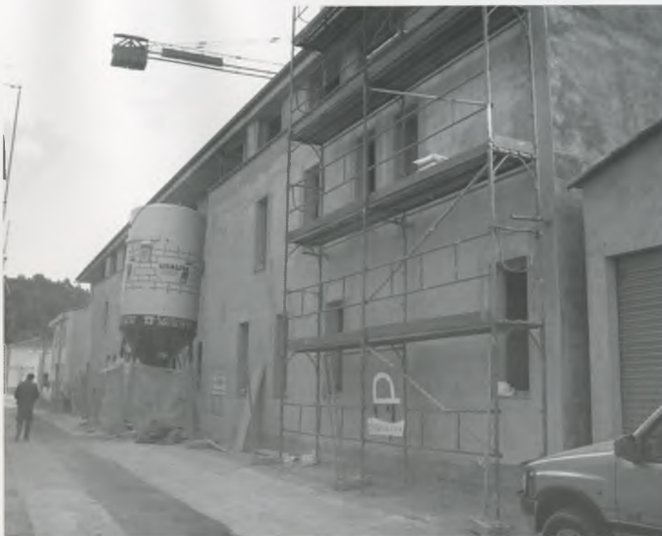
ELS HABITATGES SOCIALS ESTAN SITUATS AL CARRER SANTA ANNA.

Per tal de poder sol·licitar un d'aquests pisos calia ser veí de Bescanó i tenir d'entre 18 i 30 anys. En aquesta primera fase es van adjudicar 23 dels 24 pisos. Al quedar-ne un de lliure, l'Ajuntament va optar per ampliar la franja d'edat entre els 18 i els 40 anys.