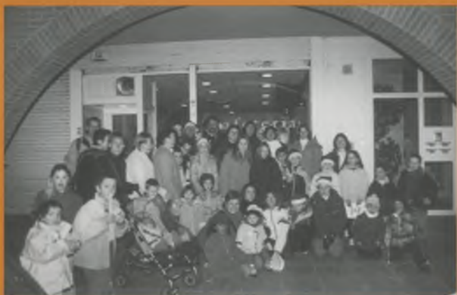
Cercavila del Tió. Parada davant de la biblioteca.