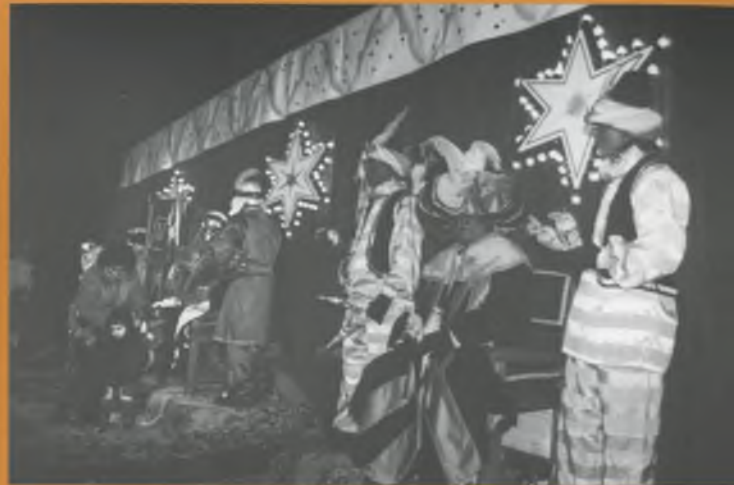
Els Reis van poder recollir els cartes de tots els nens i nenes de Bescanó.