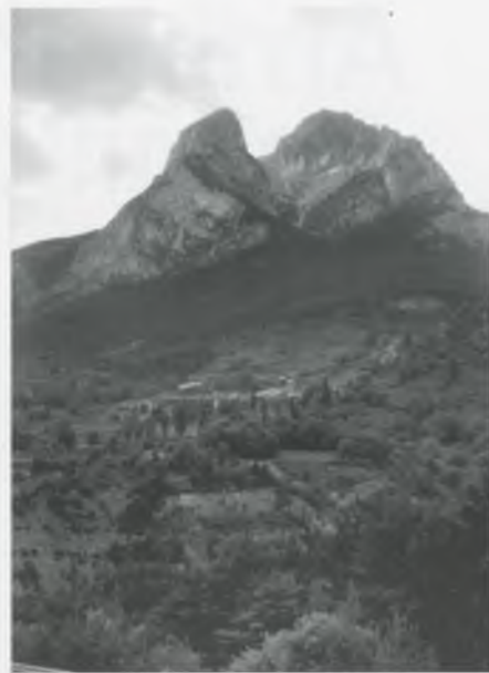
LA GOLLA HA GRIMPAT EL PEDRAFORCA.