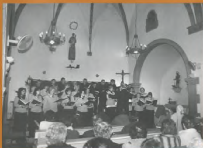
Concert de Sant Esteve a càrrec de la coral Josep Ruhi.

Finalment, les festes es van acabar amb la cavalcada de Reis. La gran quantitat d'assistents es va reflectir en la immensa cua que van fer per poder anar a saludar en persona Ses Majestats i recollir els seus regals. Com a novetat, hem de parlar del canvi del Rei Ros, que a causa d'una indisposició d'última hora va haver de ser substituït. Esperem que aquest canvi tingui continuïtat i que hi hagi rotacions també en els personatges més famosos de Nadal. A molta gent li agradaria ser Rei per un dia, començant per mi, és clar!