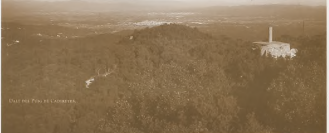
DALT DEL PUIG DE CADIRETES.