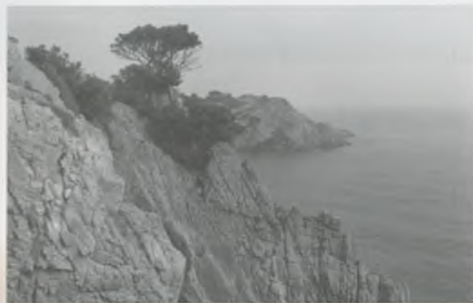
ELS CAMINS DE RONDA DE LA COSTA BRAVA.