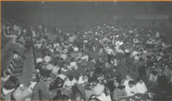
Un any més, exit total de la Quina.