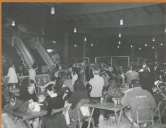
Diversió assegurada al PIN petit al polivalent.