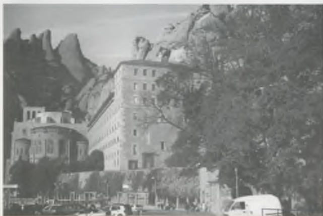
LA SERRALADA DE MONTSERRAT.