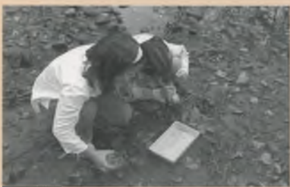
DIFERENTS MOMENTS DE L'EXCURSIÓ AL TER.