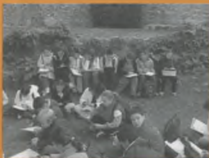
APRENT LLEGENDES I HISTÒRIES.