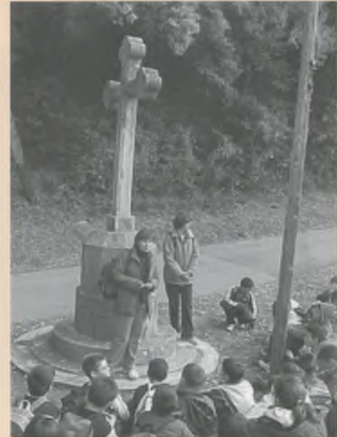
L'EXCURSIÓ ALS ALUMNES DEL CICL MITJÀ

Després vam anar a Montfullà i vam veure l'església. Vam anar al local social i també van anar a veure on van trobar restes d'un mosaic de l'època romana i vam jugar una estona més.