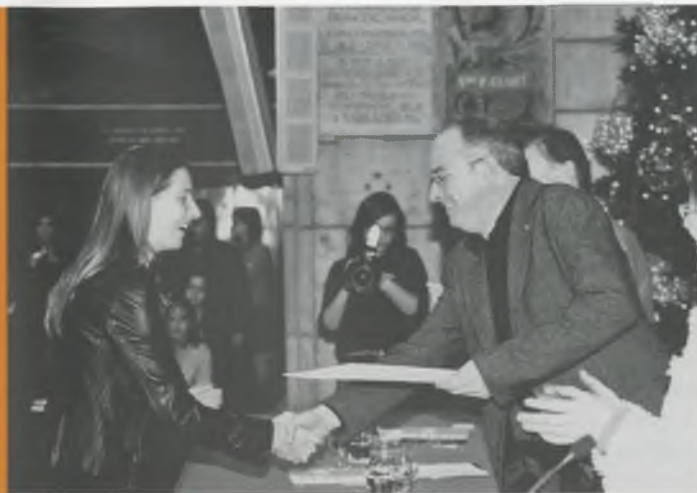
LA NORA, EN EL MOMENT DE RECOLLIR EL PREMI DE LA MÀ DEL CONSELLER EN CAP, JOSEP BARGALLÓ.