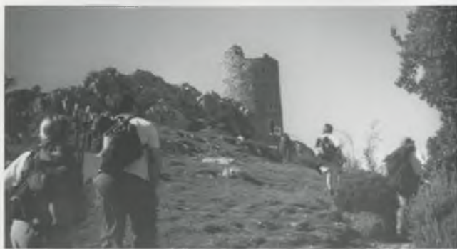
LA TORRE DE LA MASSANA A L'ALBERA.

Aquests últims mesos i amb l'esperit que ens ha guiat sempre, la Colla Excursionista Isard hem grimpat el noble escull Pedraforca, hem caminat sobre fulles a les colorides fagedes de l'Albera, en la sempre màgica Montserrat hem pujat a Sant Geroni (punt més alt de la serralada), ens hem patejat camins i boscos, verds i frescos, de la Garrotxa i com ja és tradicional de cada any, vàrem portar el Pessebre a Sant Grau. Hem estès la nostra bandera al pic de les Agudes, a l'emblemàtic Montseny, per camins de ronda hem gaudit de la nostra incomparable Costa Brava i hem esmorzat en el puig de Cadiretes a 520 metres sobre el mar a Tossa.