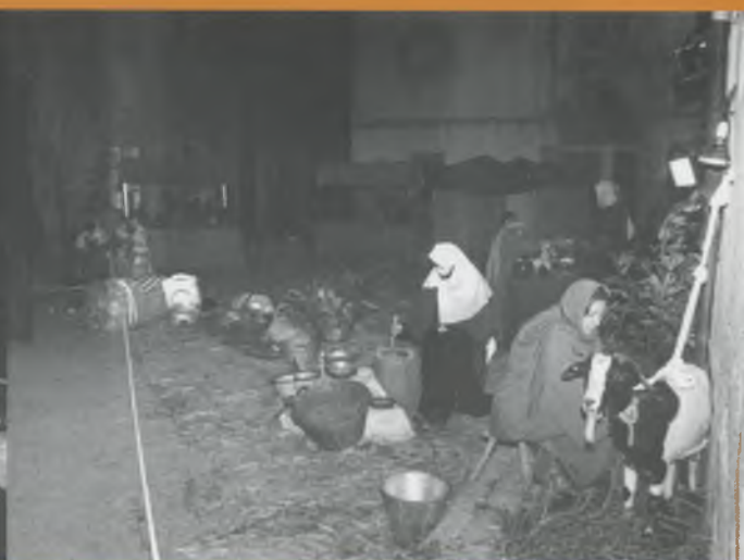
El Pessebre Vivent cada any aixeca més expectació.