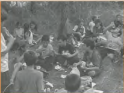
LA SORTIDA AL BOSC.