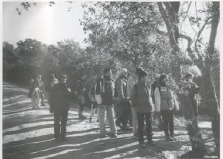
PUJANT A SES CADIRETES, DE BON MATÍ.

Tot el recorregut d'anada i tornada, es pot fer amb tres hores, sense presses i gaudint del paisatge. És aconsellable fer-ho quan la calor no apreï massa.