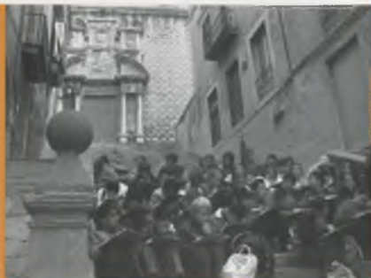
ELS ALUMNES A L'ESCALA DE L'ESGLÉSIA DE SANT MARTÍ.