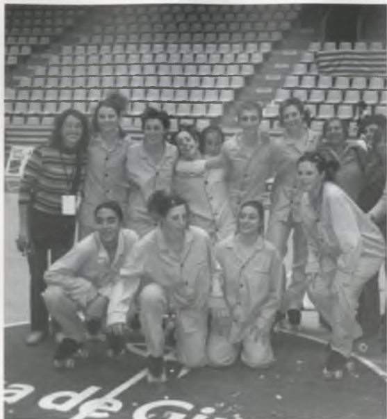
EL GRUP DE XOU DEL CLUB DE PATINATGE BESCANÓ.

ELS PATINADORS DEL CLUB HAN ACONSEGUIT MOLTS BONES POSICIONS EN ELS DIFERENTS CAMPIONATS EN ELS QUE HAN PARTICIPAT