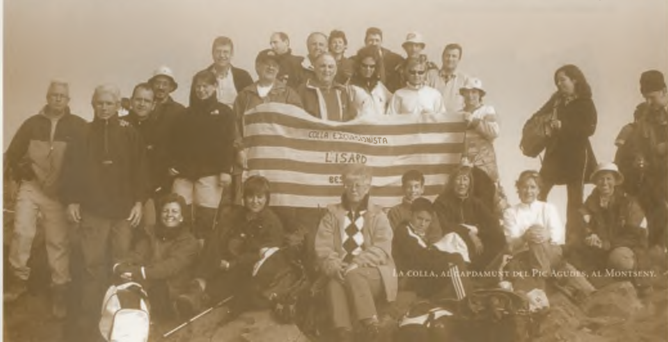
LA GOLLA, AL CAPDAMUNT DEL PIC AGÜDES, AL MONTSENY.