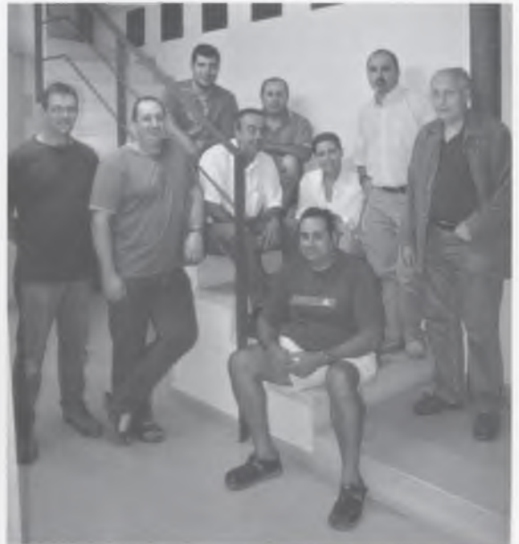
LA COMISSIÓ DEL PESSEBRE VIVENT.

La voluntat de la Comissió Pessebre Vivent és “donar a conèixer les tradicions a la mostra gent i a les persones d'altres contrades”, tal i com assenyalen en una carta que han fet arribar a La Pilastra. Així, continuen, “volem mantenir i divulgar els costums de Bescanó i un de molt important és el Pessebre Vivent”. La junta assenjala que qualsevol ajuda és bona, des de la persona que vol fer de figurant, fins aquell que vol deixar o donar objectes vells. “Seria el nostre desig –assenjala l'escrit- que la participació, tan en el Pessebre com en el Concurs, fos el més àmplia possible i per això, us invitem a tots els bescanonins i bescanonines”.